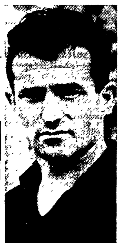
MORO il valoroso guardiano della squadra biancoazzurra