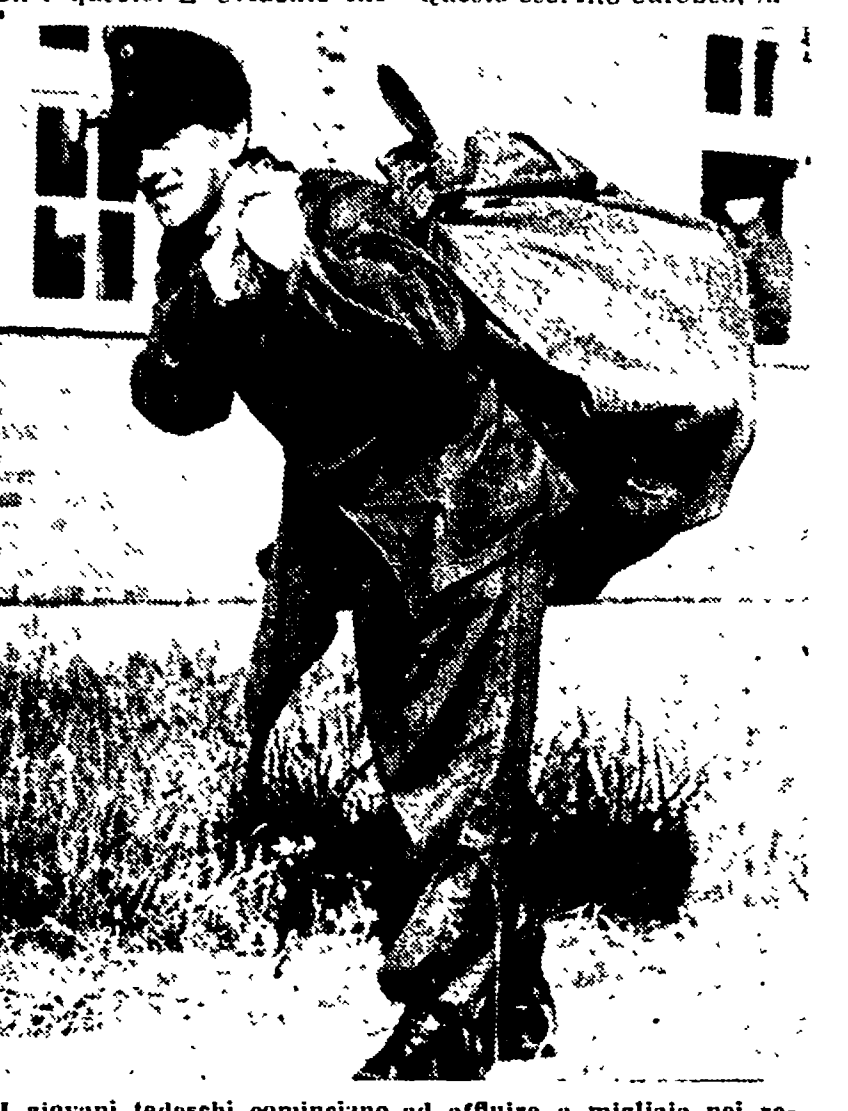
I giovani tedeschi cominciano ad affluire a migliaia nei reparti della polizia della Germania occidentale, che sono destinati a costituire l'ossatura della riserva Wehrmacht

Questa comunità che non è né europea né di difesa... Liquidazione degli eserciti nazionali - Ci resteranno soltanto i corazzieri e la Celere - Le divisioni ex-naziste