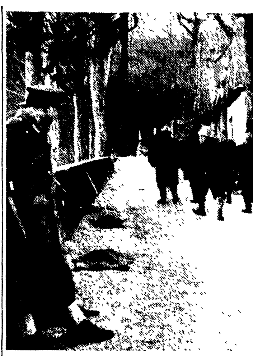
LUCCA - Dopo l'immane selagura alla polveriera di Galliano, partono le prime squadre di soccorso. A terra, coperti pietosamente, giacciono alcuni miseri resti delle vittime