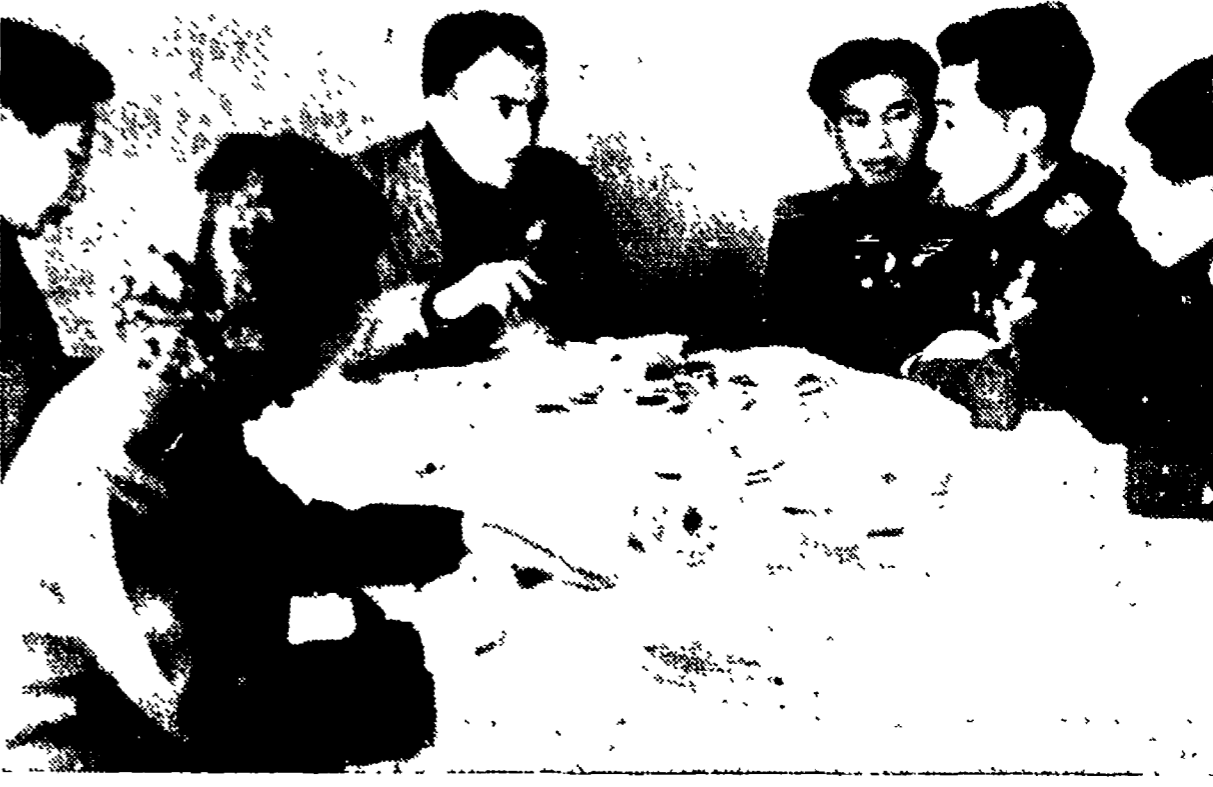
PHYONGYANG — Il nostro inviato Riccardo Longone a colloquio, in un ristorante sotterraneo della capitale, con due maggiori e un tenente dell'Esercito popolare coreano

dei letterati e quella dei guerrieri o generali. La casta dei generali era profondamente disprezzata da quella dei letterati da cui venivano fuori i funzionari. Ma la casta dei letterati a sua volta era disprezzata da quella dei guerrieri.