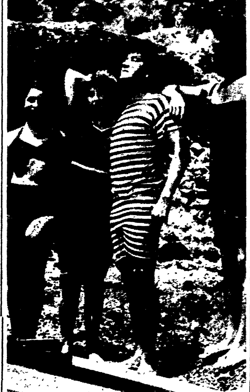
Dado Ruspoli (il secondo da destra) si esibisce sulla spiaggia di Capri, assieme ad alcuni altri esemplari della nostra aristocrazia, in una rievocazione del «bel tempo che fu»

quella (3). Si sono mescolati i due tipi di proprietari: i possessori tradizionali e uomini nuovi del capitale finanziario, nobiltà titolata e aristocrazia del denaro.