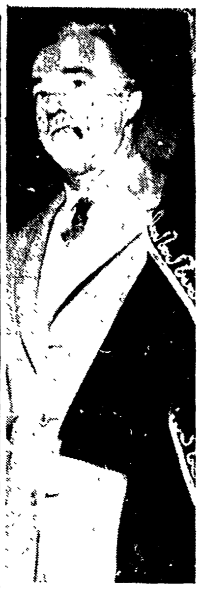
PARIGI - Vittorio De Sica, lasciato momentaneamente in regia, torna nelle vesti di attore, interpretando una parte di rilievo nel film «Madame de...»

18 aprile 1953): un articolo del noto padre Bruccoleri verso le elezioni, spiega allo stesso elettorato perché, anche se non è contento della politica del governo, non deve negare il suo suffragio alla coalizione democratica.