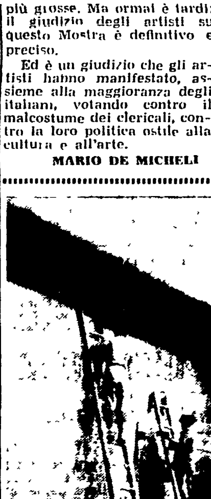
CINA - Un momento dei lavori per la costruzione della gigantesca diga di Samba...

Poi arrivò il presidente del Consiglio, l'on. De Gasperi, faccia terra, sguardo fisso in avanti: tra la freddezza generale, attraverso le sale a vuotucello, e la Mostra fu involato oltre 500 artisti.