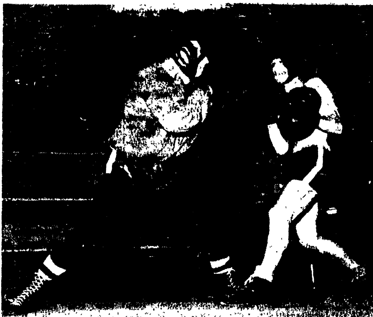
Tiberio Mitri, l'ex campione d'Europa dei pesi medi, sta portando a termine la sua preparazione per l'incontro che tornerà al Forò Italiano. Un incontro che si prevede pieno di emozioni (tecniche e spettacolari). Tiberio (a sinistra nella foto) in uno dei suoi quotidiani allenamenti nella palestra dello stadio «Torino», colpisce con un fulmineo diretto sinistro ma alla spalla il suo volenteroso compagno di scuderia il dilettante peso welter Bottoni