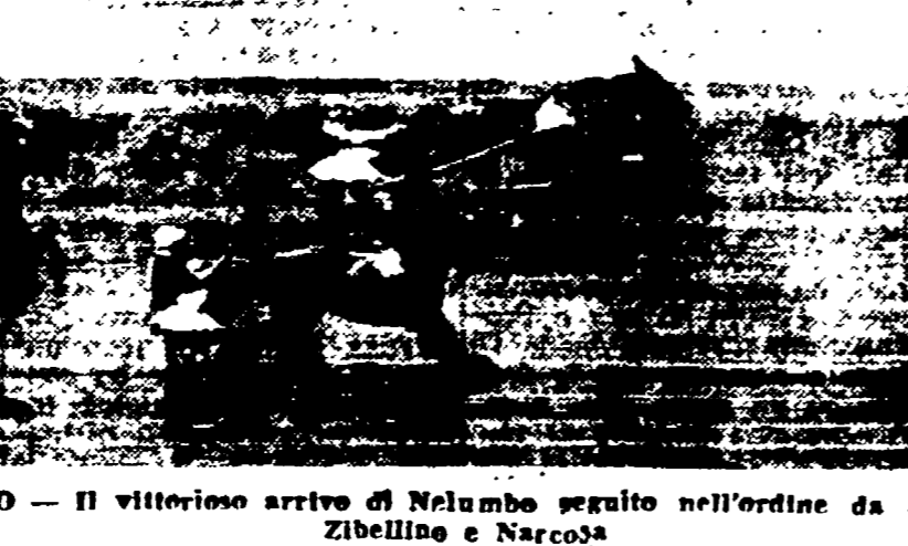
XXVI DERBY DEL TROTTO - Il vittorioso arrivo di Nelumbo seguito nell'ordine da Zima, Nankino, Sisturi, Zante, Zibellino e Narcosi

Non a caso (non è troppa) nulla si è mosso con la resistenza di un cavallo che si è visto gli occhi assegnato nei confronti di Nankino non facciano prevedere, giustamente, la sua affermazione di forza d'altalena.