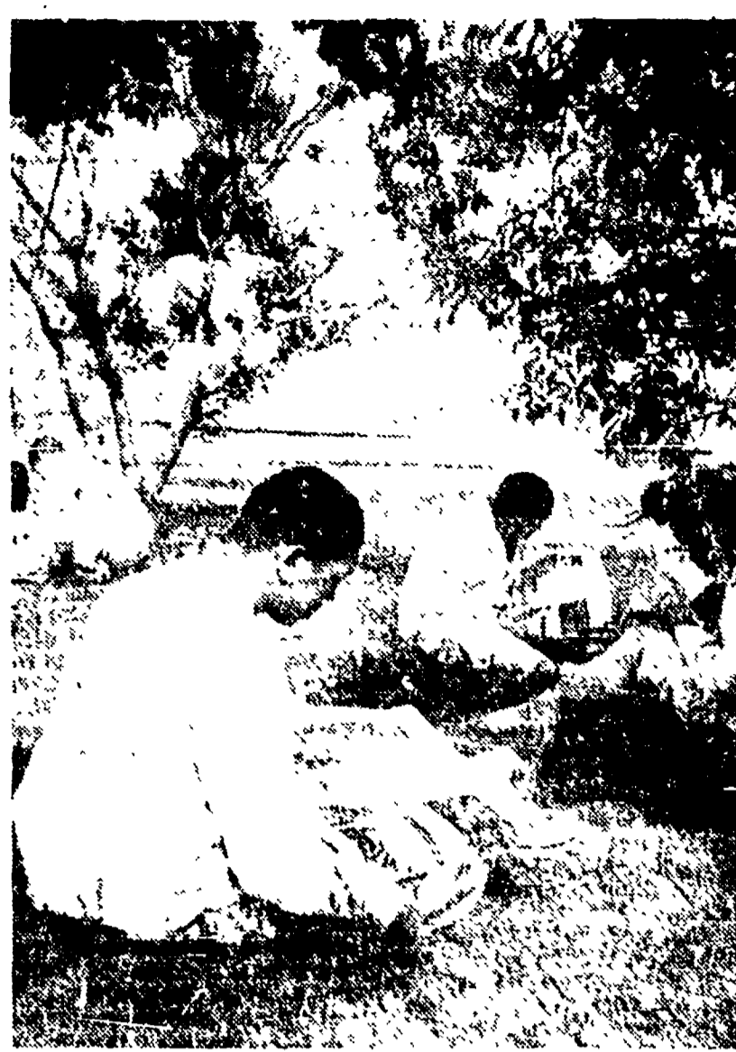
CINA - Vantanti del popolo, convalescenti dalle ferite riportate nei combattimenti in Corea, si dedicano alla lettura nel giardino di una casa di riposo del Nord-Est cinese