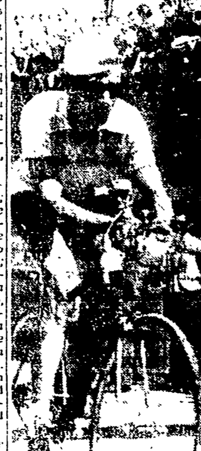
Assisti Fausto Coppi il presidente del Tour è tutto per KOBLET ma...

Ma non cancellerà dal suo disegno tutta la grossa montagna. Ecco, infatti, ancora i Pirenei in due tappe - da Pau a Cauterets, il Col d'Aubisque, il Col du Tourmalet, il Col d'Aspin e il Col du Peyresourde - e, ecco, da Gap a Briançon, il Col de Vars e il Col de l'Eclair, nel