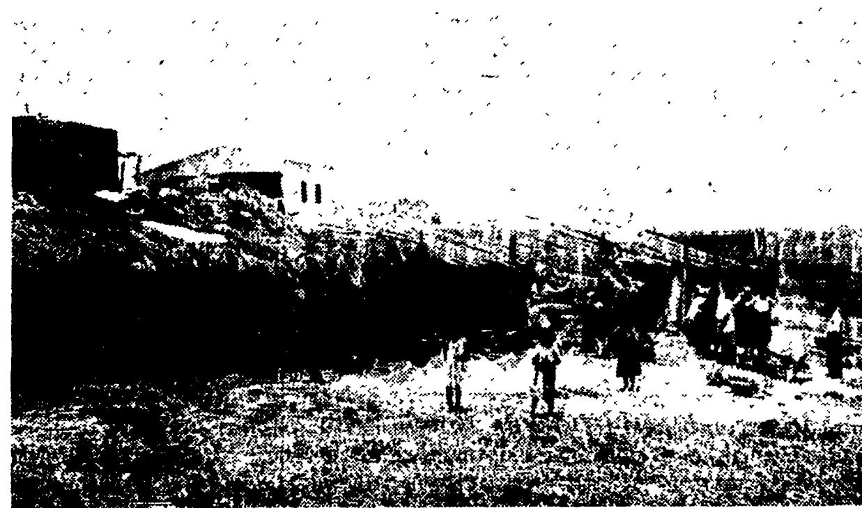
JANNELLO (Crotona) — Le squallide baracche dove vivono da due anni trenta famiglie di «assegnatari» dell'Ente Sila in inumane condizioni di promiscuità e di sporcizia...