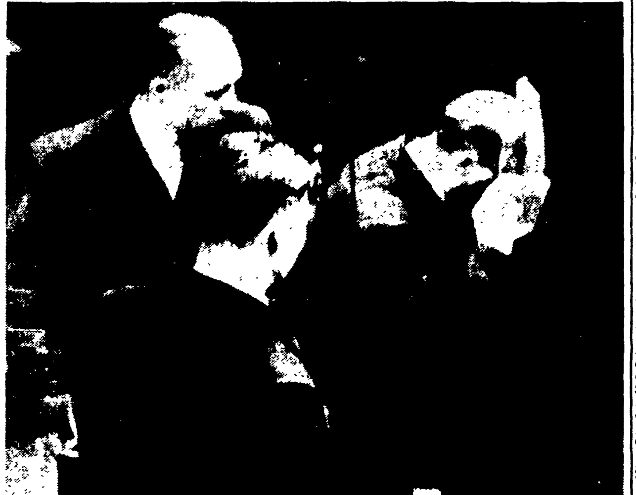
John Reinald Christie pochi giorni dopo il suo arresto

in quali circostanze, in una lontana notte, nel commissariato di Notting Hill, Evans si accese di assassinio.