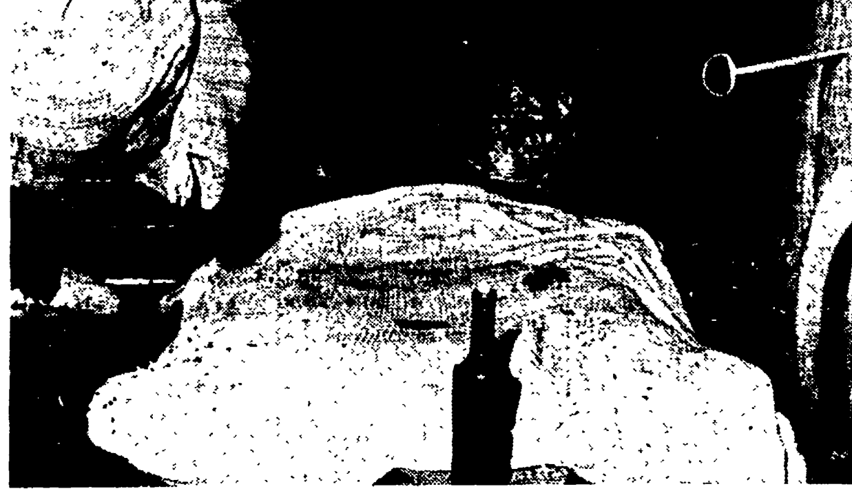
JANNELLO (Crotona) — L'interno di una delle baracche degli «assegnatari». In ambienti come questo, su letti su quali si affollano le mosche e i moscerini d'ogni genere, vivono ammassate otto, dieci, a volte perfino dodici persone