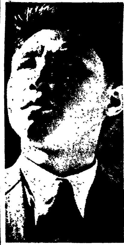
Kim Ir Sen

Kim Ir Sen. Il ministro degli Esteri della Corea del Nord ha parlato al cinquantenario del P.C.U.S. a Mosca.