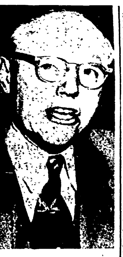
Il senatore Taft

Il leader repubblicano è deceduto in una clinica di New York dopo lunga malattia