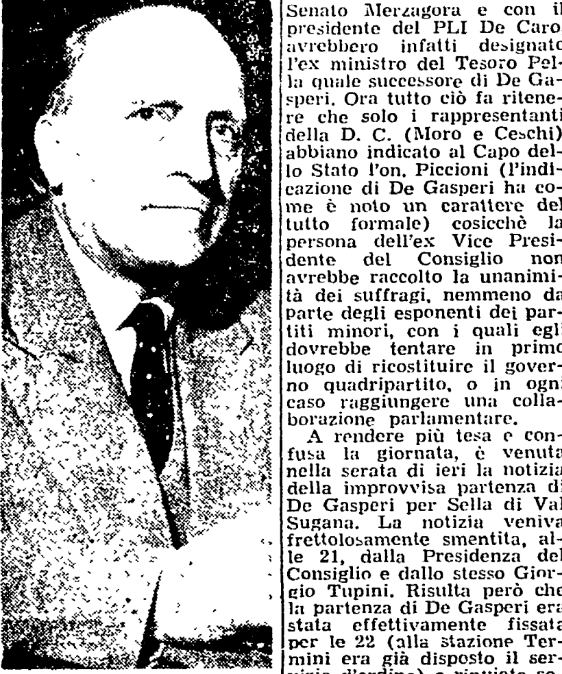
Picconi, il candidato dc dopo il siluramento di De Gasperi, ha l'appoggio delle destre e cerca i voti dei « minori »

al Quirinale il designato per la formazione del nuovo governo. Stando alle indicazioni che si hanno il Capo dello Stato avrebbe avuto in vista i rappresentanti politici consultati giovedì e venerdì una serie di designazioni contrastanti le quali avrebbero resa più delicata e difficile la scelta dell'uomo destinato a dar vita al nuovo gabinetto. Alcune personalità indipendenti, insieme con il Presidente del Senato Merzagora e con il presidente del Pli De Caro, avrebbero infatti designato l'ex ministro del Tesoro Pella quale soluzione. Alcune personalità indipendenti, insieme con il Presidente del Senato Merzagora e con il presidente del Pli De Caro, avrebbero infatti designato l'ex ministro del Tesoro Pella quale soluzione. Alcune personalità indipendenti, insieme con il Presidente del Senato Merzagora e con il presidente del Pli De Caro, avrebbero infatti designato l'ex ministro del Tesoro Pella quale soluzione.