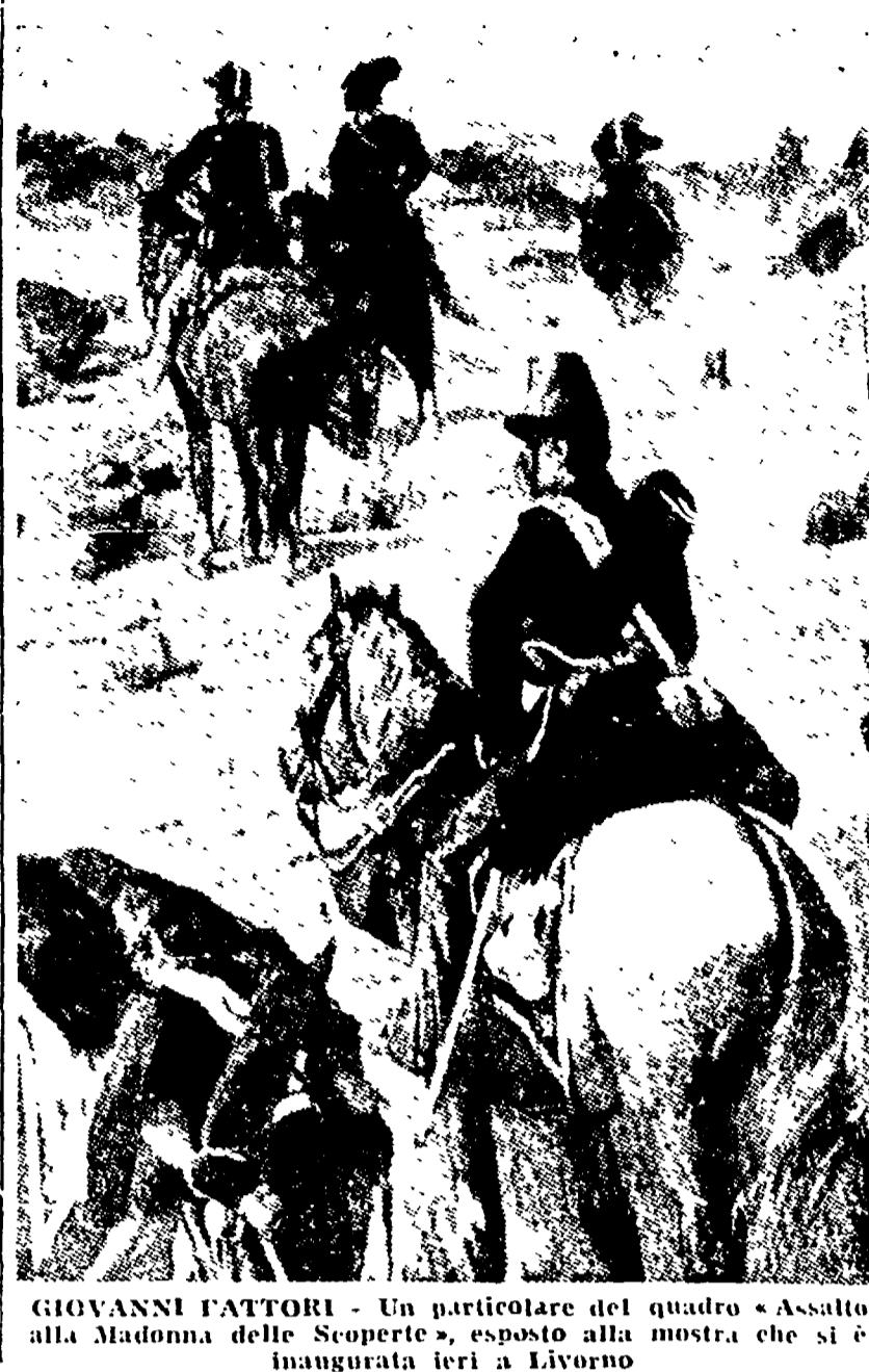
GIOVANNI FATTORI - Un particolare del quadro «Assalto alla Madonna delle Scoperte», esposto alla mostra che si è inaugurata ieri a Livorno