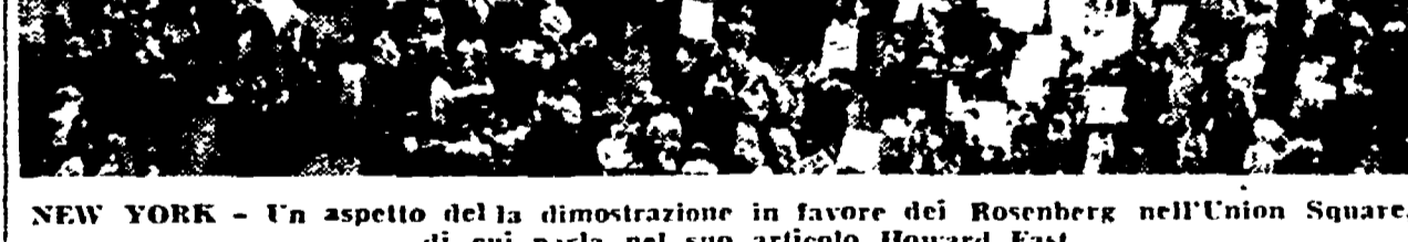
NEW YORK - Un aspetto della dimostrazione in favore dei Rosenberg nell'Union Square, di cui parla nel suo articolo Howard Fast