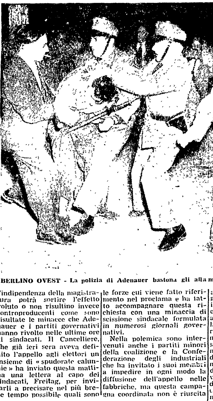
BERLINO OVEST - La polizia di Adenauer bastona gli allamati della zona americana

BERLINO, 1. — L'atmosfera elettorale in Germania occidentale si è improvvisamente riscaldata per merito di due fatti che hanno reso ancor più precaria la posizione del Cancelliere Adenauer.