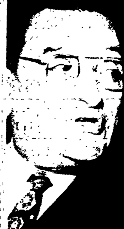
Il presidente Laniel

PARIGI, 21. - Evitare a qualunque costo il dibattito all'Assemblea nazionale, questa è la preoccupazione che domina in questo momento il governo francese e i gruppi che lo sostengono. A questo gioco si sono prestati oggi stesso i membri dell'Ufficio di presidenza della Camera dei deputati, i quali, basandosi su un cavillo procedurale, hanno sospeso l'ordine della domanda di convocazione e rinviata a lunedì ogni decisione.