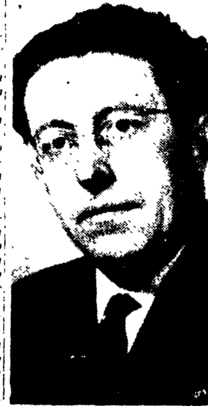
Il compagno Pietro Secchia

Il fatto decisivo è che quando il governo Pella si è costituito, ha perduto il suo carattere di governo di transizione, per diventare un governo di fatto. L'on. Pella ha poi presentato la sua credenziale come un modesto governo di transizione, ma disposto a lasciare al momento opportuno il posto ad un altro ministero, politicamente più caratterizzato. Naturalmente resta da vedere quando e chi siederà al governo perché i sindacati e i lavoratori non si lascino ingannare. Infine l'on. Pella è riuscito a ottenere un momento di quiete in questo momento - i guadagni più rabbiosi della D. C. ed ha parlato un linguaggio assai facilmente inusitato da un ministro.