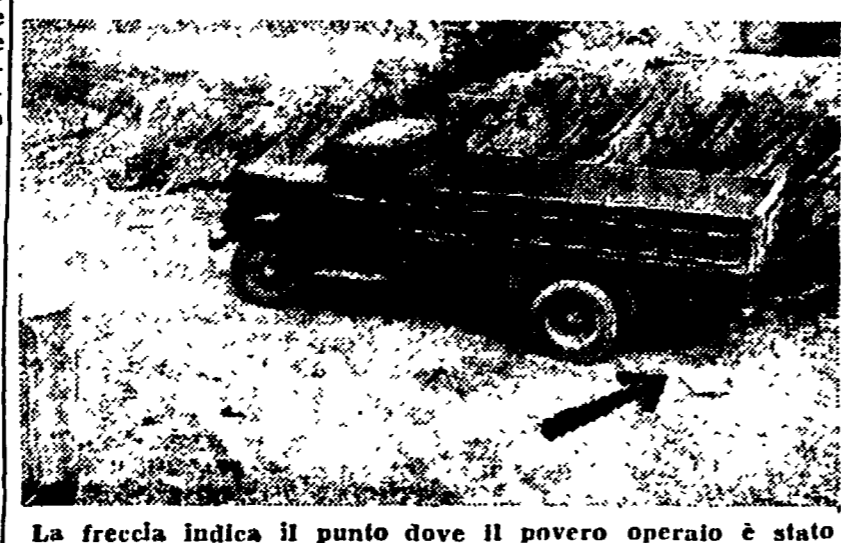
La freccia indica il punto dove il povero operaio è stato schiacciato dall'autocarro