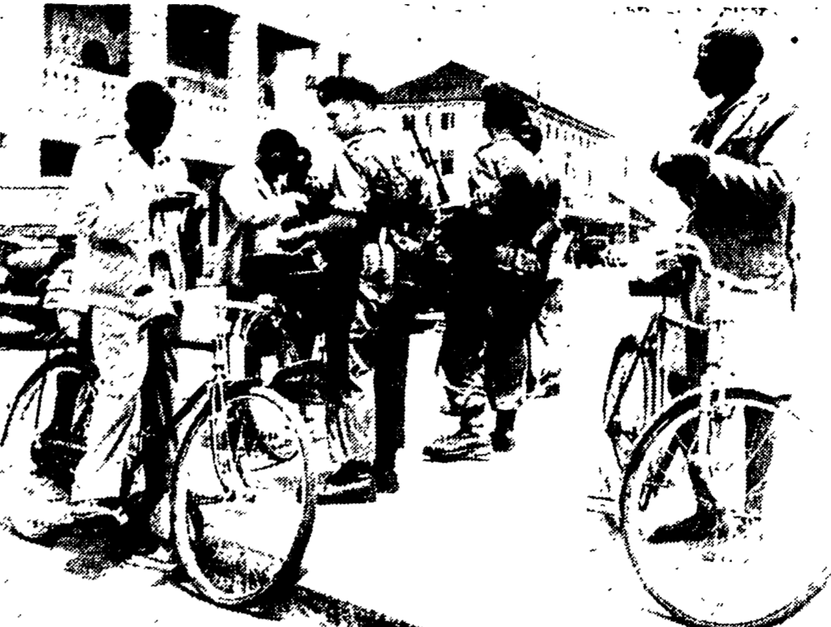
NAIROBI — Soldati inglesi perquisiscono in una via centrale della capitale del Kenia, alcuni lavoratori che si recano al lavoro. Il comando coloniale ha annunciato ieri, all'altro feroce rappresaglia contro la popolazione durante la quale sono state uccise cento persone e ferite oltre trecento. Nelle scorso settembre le truppe inglesi hanno trucidato 2786 africani con il pretesto della appartenenza alle cosiddette bande Mau-Mau.