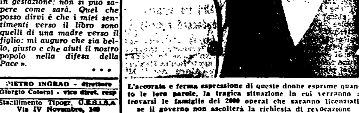
L'accorata e ferma espressione di queste donne esprime quanto le loro parole, la tragica situazione in cui verranno a trovarsi le famiglie dei 2000 operai che saranno licenziati, se il governo non ascolterà la richiesta di revocazione