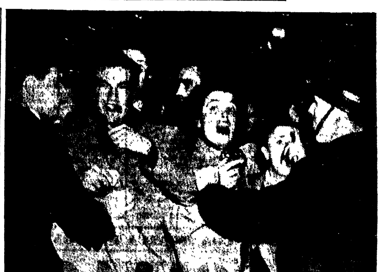
TRIESTE - Provocatori titisti mentre inscenano una gazzarra in via Cicerone (Telefoto)