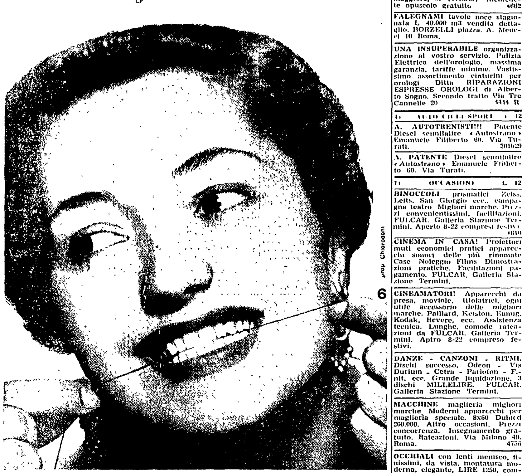
ma i denti al Chlorodont, che denti! sani forti belli con dentifricio Chlorodont anticarie al fluoro

A APPROFITATE! Grandiosa svendita Mobili tutto stile Cantù e produzione locale. Prezzi sbalorditivi. Massime facilitazioni pagamenti. Satrio-Gennaro Milano Napoli Chiala 238. A. ARTIGIANI Centro svendo camerletto pranzo ecc. Arredamenti granitico - economici, facilitazioni - Tarsi 32 (dirimpetto Enali). A. IMPERMEABILI - soprabiti - piolet - Ultime creazioni, offre Sartoria MESSCHINO, senza anticipo, prima rata gennaio 1954 (590.512).