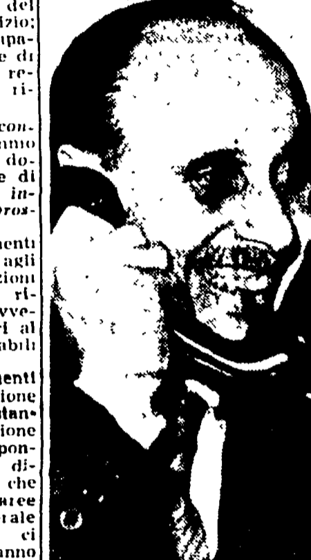
Fronto? La tabaccheria capitoline? Per i venti pacchetti di sigarette, il Comune proprio adesso i contributi di migioria.

Per nulla intimoriti, i quattro, proseguendo nella folla corsa andavano a correre contro un'attesa che si era in attesa. Ma, con abile manovra, riuscirono a scappare e riprendere la fuga.