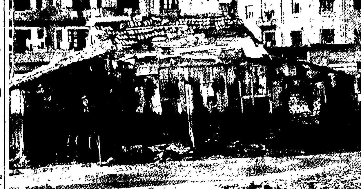
Grave rovina dei paesi a Reggio Calabria. Baracche di questo tipo ci sono anche a Catanzaro...