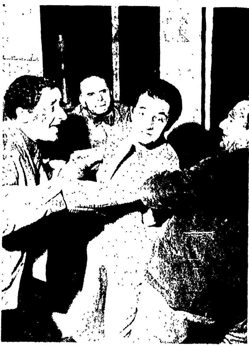
Al Teatro delle Arti di Roma, la Compagnia degli spettatori italiani prepara «La Mandragola»...