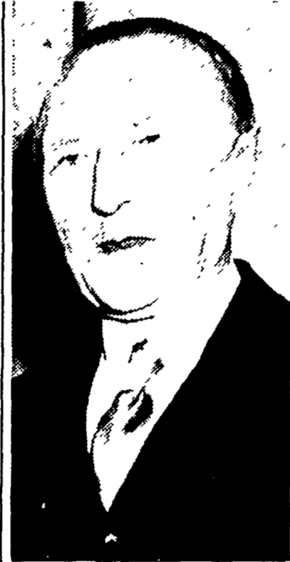
Konrad Adenauer (giorno di guerra) lo speciale ufficio nazista incaricato di studiare le «armi segrete» per l'esercito di Hitler.