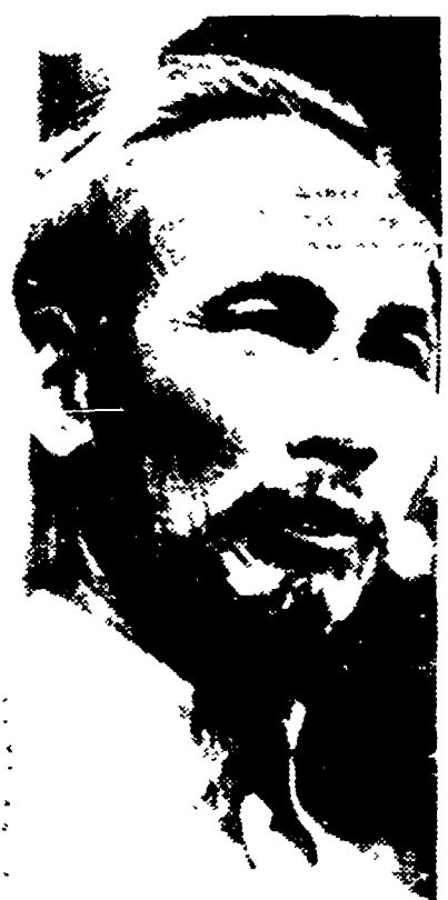
Il presidente Ho Chi Minh

SAIGON, 18. - La radio della Repubblica democratica del Viet Nam ha dato notizia oggi della prossima liberazione di centinaia di francesi caduti prigionieri nel corso delle operazioni militari... «Dobbiamo meditare l'esempio magnifico che ci dà tutto un popolo intento alla ricostruzione della sua Patria»