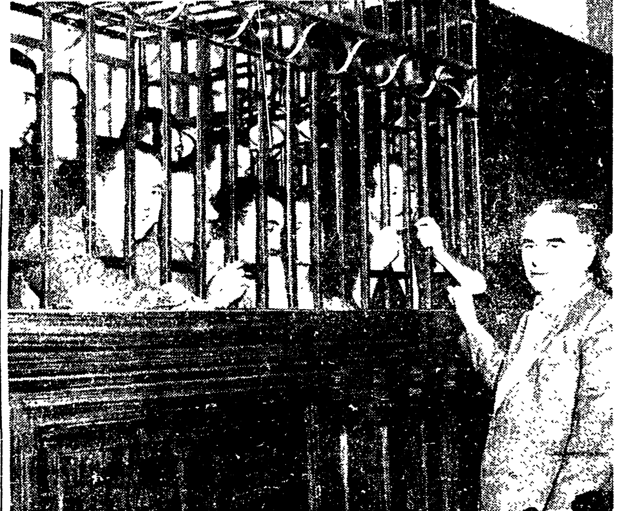
Col provvedimento di liberazione condizionale contenuto nell'indulto emanato dal Parlamento, molti partigiani potrebbero riacquistare subito la libertà. E fra essi quelli ingiustamente condannati dalla Corte d'Assise di Macerata per l'uccisione dei conti Manzoni ai quali il compagno Longo, durante il processo, recò la solidarietà di tutti i democratici

« La legge non è esclusivamente quella che il Paese auspicava e attendeva. Ma nonostante le esclusioni inserite a danno di alcuni partigiani e di reati tipicamente politici (come una parte del varo articolo 12, che esclude dalla amnistia e dall'indulto i reati commessi in un atto di clemenza frutto della nuova situazione politica e parlamentare determinata dal programma elettorale prima del 7 giugno e che lo stesso governo Pella si impegnò a presentare al Parlamento.