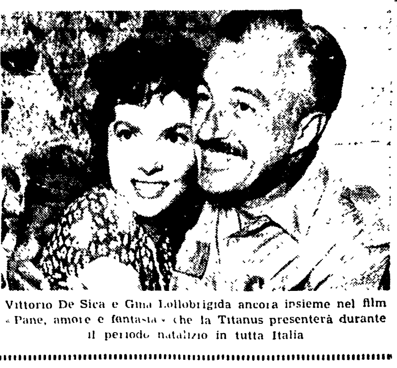
Vittorio De Sica e Gina Lollobrigida ancora insieme nel film «Pane, amore e fantasia» che la Titanus presenterà durante il periodo natalizio in tutta Italia

IL FILM PIU' LIETO UMANO E SEMPLICE DELL'ANNO: PANE, AMORE E FANTASIA