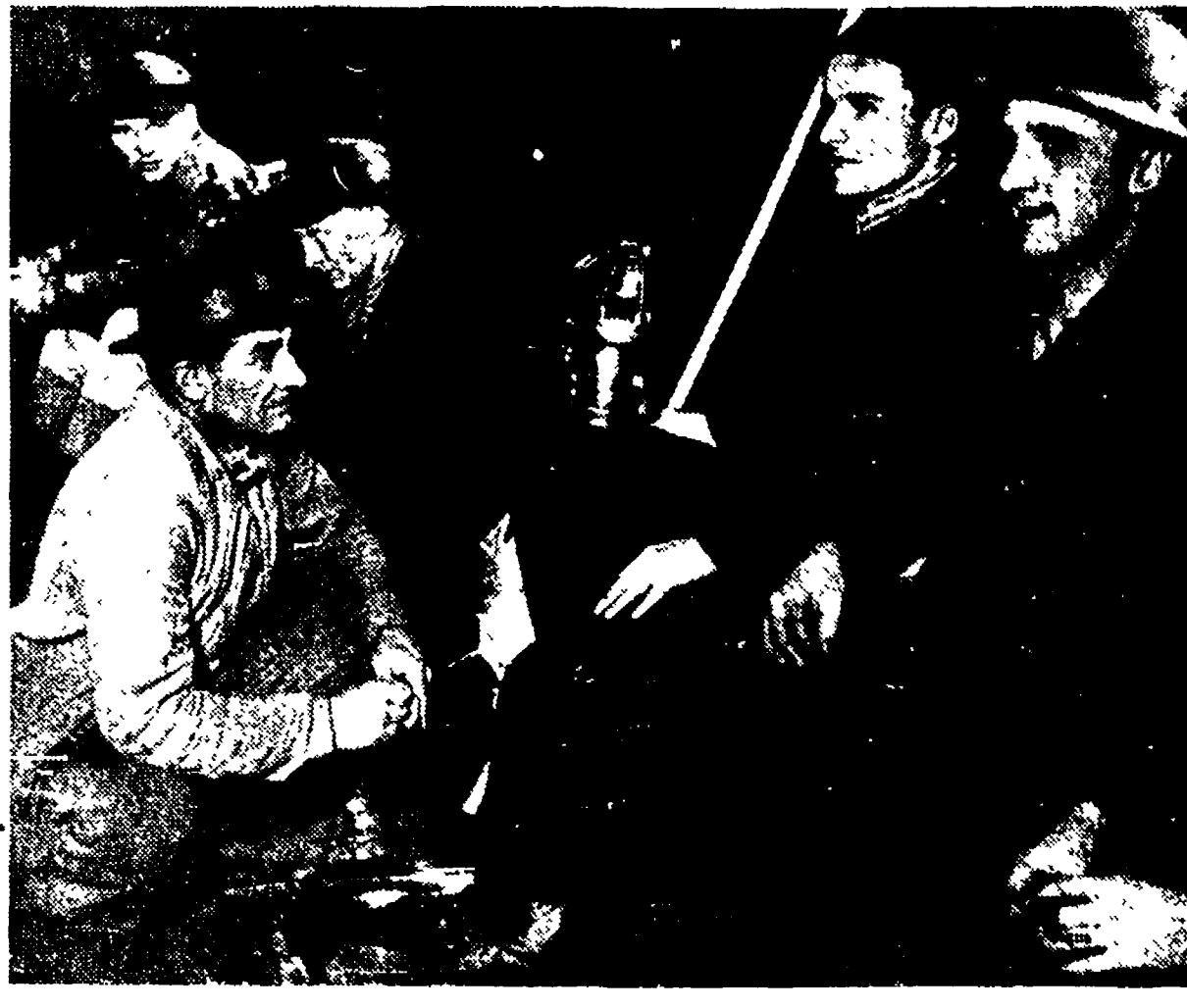
UN NUOVO GESTO DI AMICIZIA PER LA FRANCIA