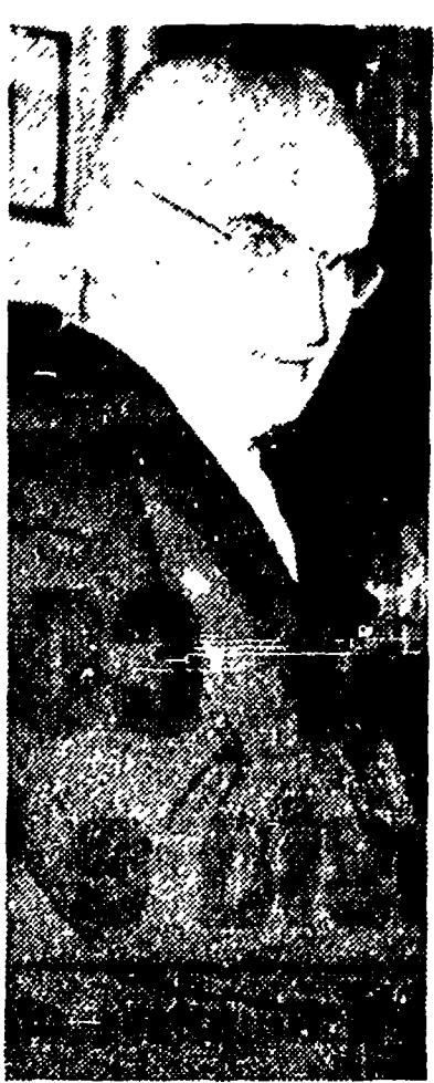
Il Presidente della Repubblica...