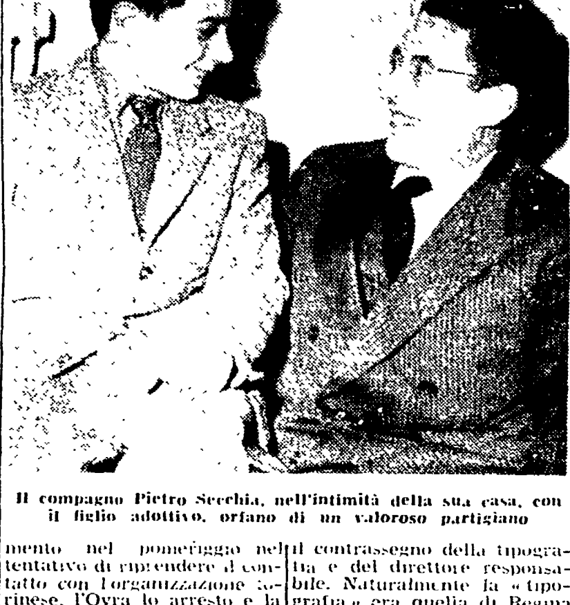
Il compagno Pietro Secchia, nell'intimità della sua casa, con il figlio adottivo, orfano di un valoroso partigiano