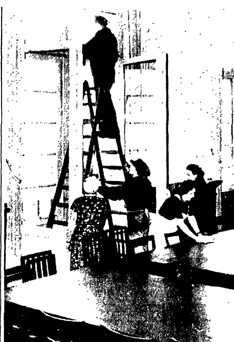
BERLINO — Preparativi in una sala dell'edificio proposto dagli occidentali come sede della conferenza a quattro