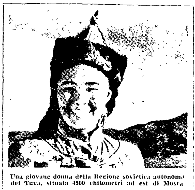
Una giovane donna della Regione sovietica autonoma del Tuva, situata 4500 chilometri ad est di Mosca

Da domani In treno da Mosca a Pechino attraverso Siberia e Manciuria