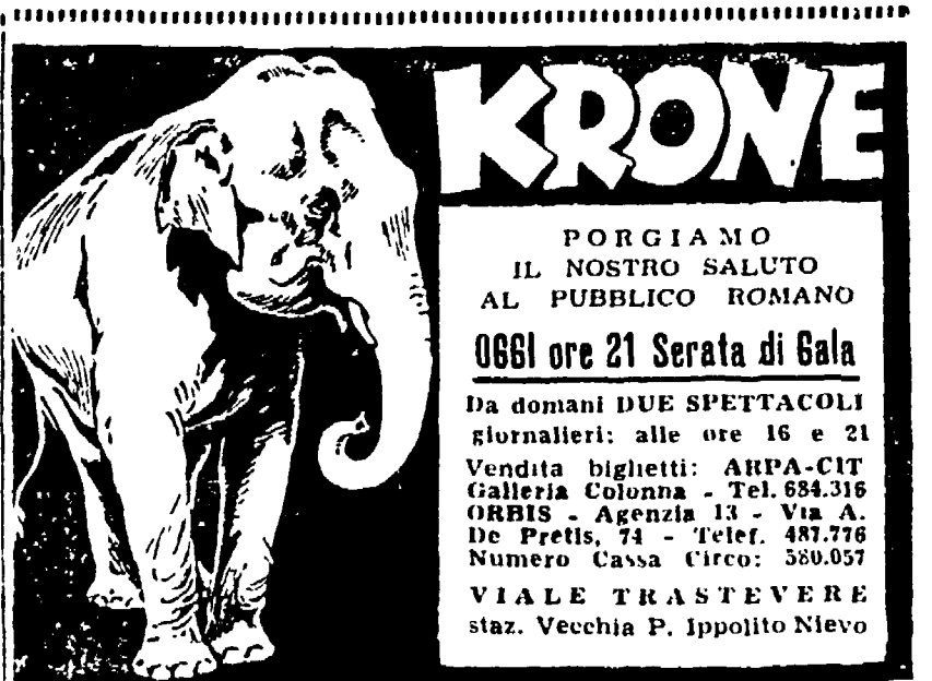
Il Circo è completamente riscaldato