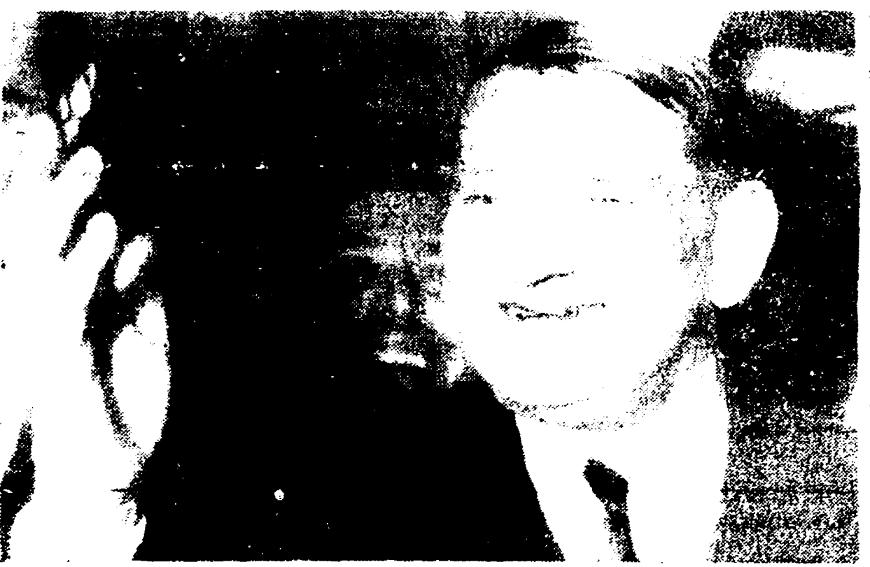
VERSAILLES - Il nuovo presidente Coty, eletto dopo la vittoria della maggioranza governativa.

La scialba figura del neo-eletto, imposto dai gruppi della maggioranza governativa nel tentativo di impedire una confessione della politica europeista