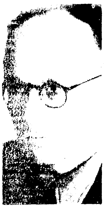
Domenico Terracini, presidente della Provincia di Roma, in un momento delle onoranze per il decennale della Resistenza.

Il primo tentativo dei fascisti di impedire le celebrazioni — Lunedì la presentazione del bilancio Le nobili parole dell'on. Enochiano Aprile — Il primo tentativo dei fascisti di impedire le celebrazioni — Lunedì la presentazione del bilancio Le nobili parole dell'on. Enochiano Aprile — Il primo tentativo dei fascisti di impedire le celebrazioni — Lunedì la presentazione del bilancio