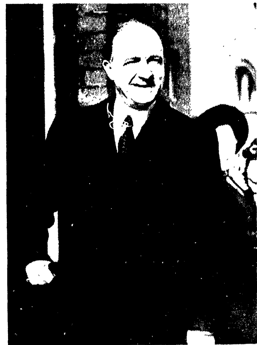
Il Cancelliere dello Scacchiere Richard Butler

LONDRA, 31. - Il Cancelliere dello Scacchiere Butler è partito ieri da Londra per Sidney dove dirigerà la delegazione inglese alla conferenza del Commonwealth che si inizia il 18 gennaio.