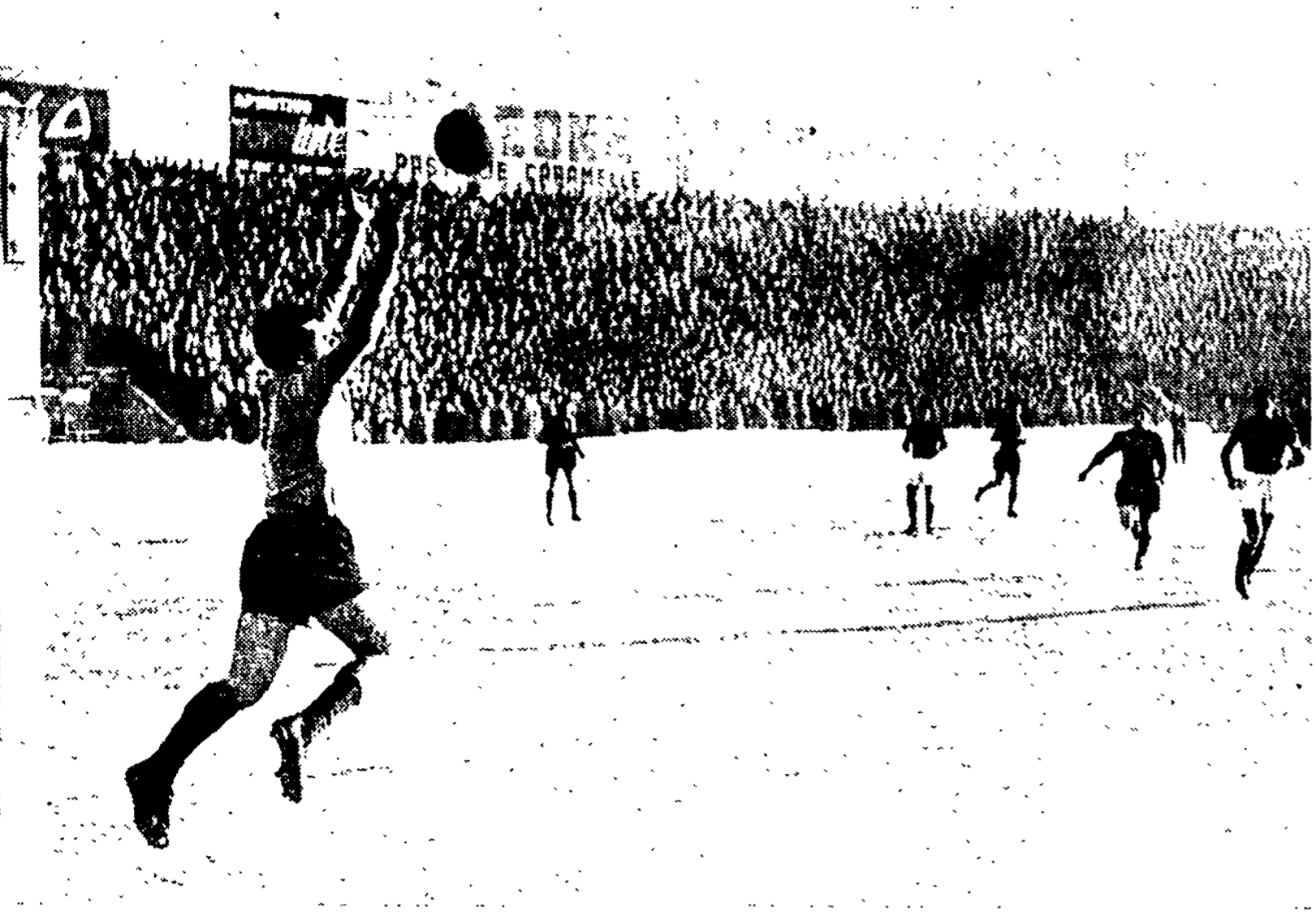
TORINO-INTER 1-1 - Neve e freddo hanno fatto da cornice al drammatico incontro di Torino tra i granata ed i campioni d'Italia. Nella foto: una bella parata alta di SOLDAN