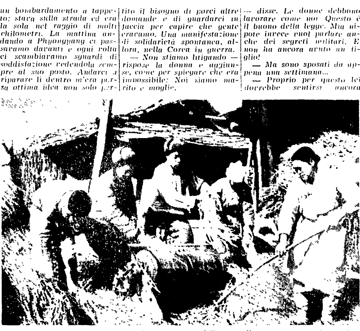
COREA - Volontari cinesi aiutano una famiglia contadina nel lavoro dei campi