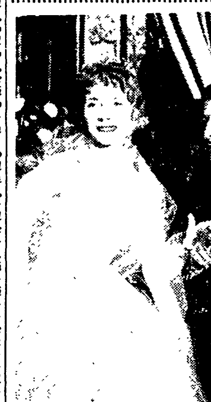
VALENTINA CORTESE la deliziosa e appassionata attrice che dà anima e volto al personaggio di «Lisa» nel film a colori «LA PASSEGGIATA» diretto e interpretato da Renato Rascel e che sta ottenendo un autentico successo di pubblico e di critica

Per questo i suoi articoli sono stati pubblicati anche dagli altri giornali, come la Jugoslavia. Per ora gli organi della «Lega dei comunisti» della Slovenia e la Voce del Popolo di Fiume. Anche il Progresso tirino di sabato ne ha pubblicato uno. Per la stampa di Fiume erano già state organizzate discussioni nella «Lega dei Comunisti» poiché tutti erano sicuri che si trattava di direttive di Gilas. Per ora il giornale di Trieste, il Corriere di Trieste nella corrispondenza da Belgrado scrive testualmente: «Nella conferenza di Tito, è stato annunciato che la possibilità di qualsiasi sanzione a carico di Gilas poiché nei circoli dirigenti è il suo carattere esuberante che da lungo