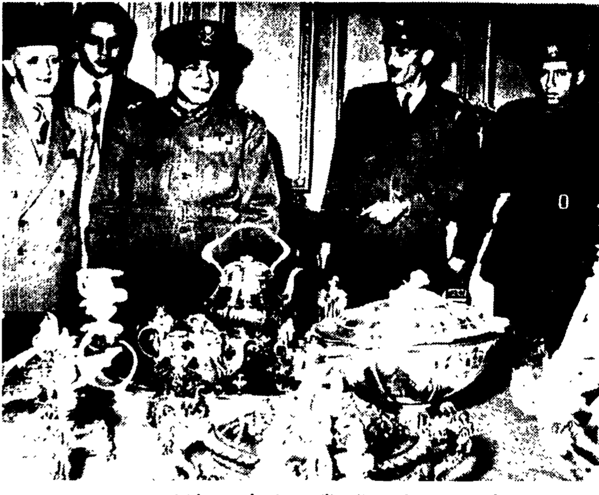
IL CAIRO — Ha avuto inizio al Cairo la vendita all'asta delle collezioni di Faruk. Nella foto, il generale Naphib, nel vestibolo del palazzo reale di Koubbeh, dove si svolge la vendita.