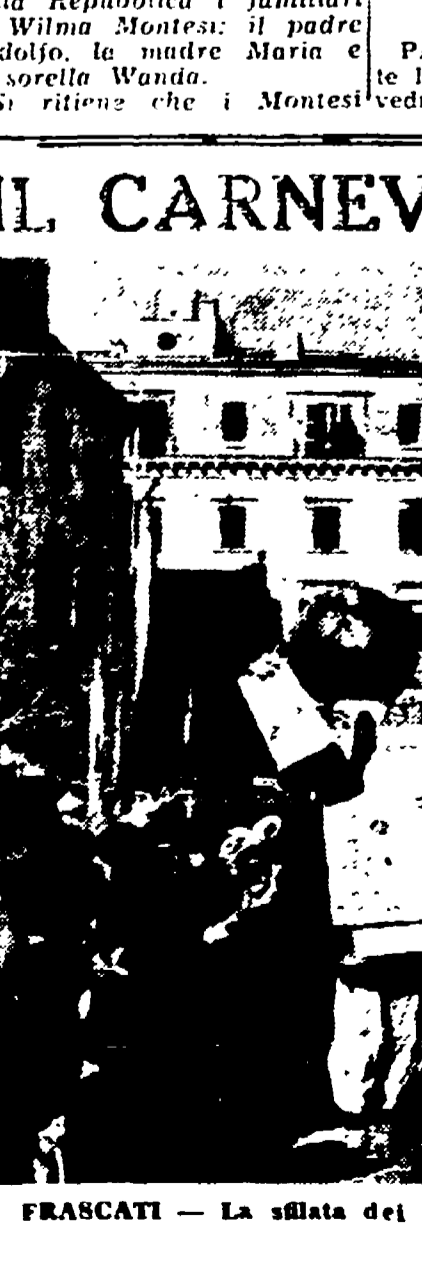
FRASCATI — La sfilata dei grandi pupazzi del Carnevale che ha avuto domenica grande successo