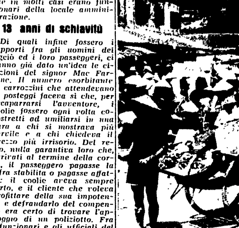
PECHINO - Tiratori di «rigicci» in una vecchia foto cinese