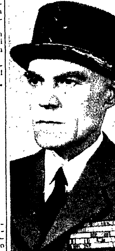
Il generale Paul Ely, nuovo comandante supremo delle forze franco-collaborazioniste in Indocina...