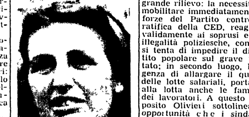
La compagnia Rodano

La nostra lotta — prosegue l'oratore — non si può più fermare alle aziende, dovrà essere una lotta generale di categoria e di quartiere, le cui popolazioni saranno chiamate a stringersi intorno alle fabbriche per sostenere l'azione dei lavoratori in questa nuova fase della battaglia.