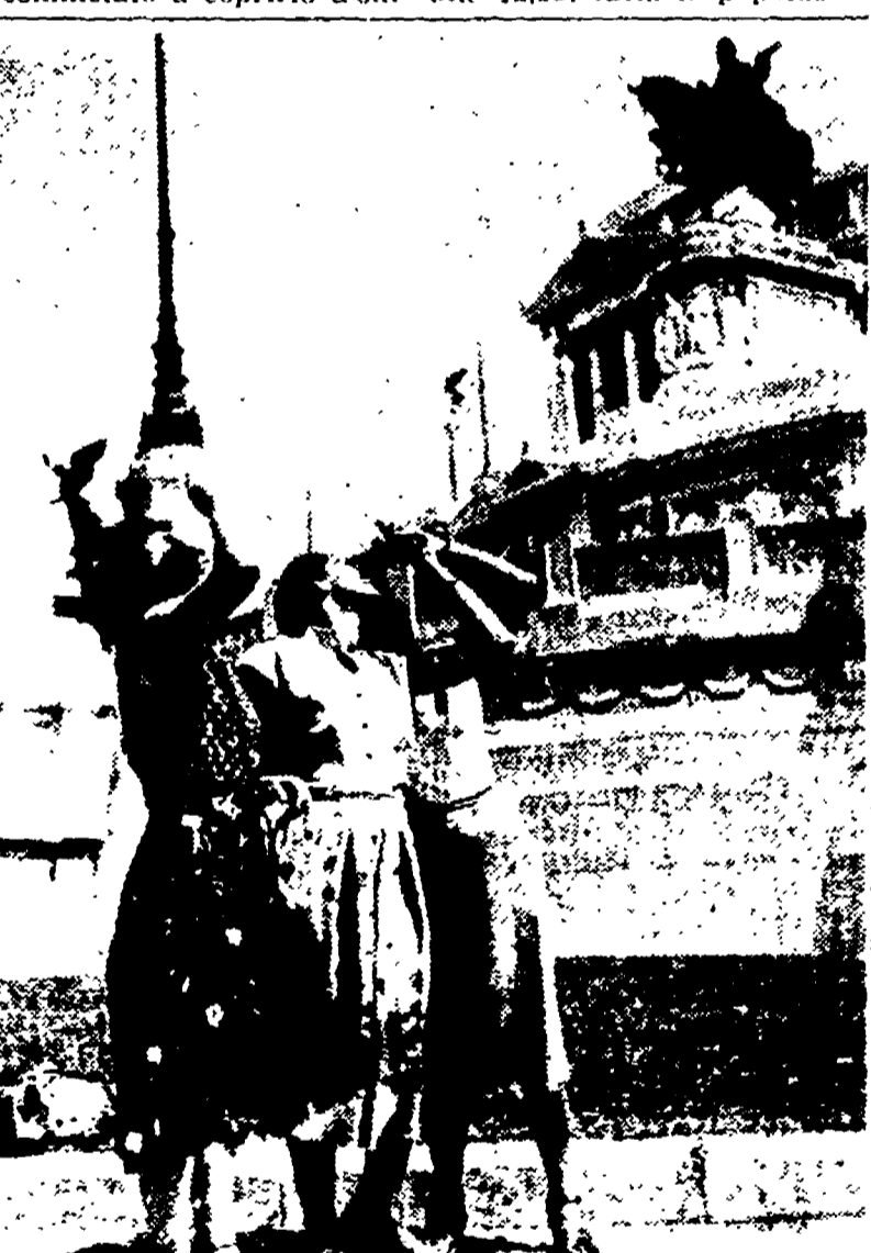
Tutta Roma ieri ha seguito le fasi dell'eclissi osservando l'astro, nudo all'occhio. Specialmente i ragazzi si sono rivestiti dei curiosissimi osservatori dell'eclissi.

L'eclissi parziale di sole verificata ieri con l'estrema precisione dei dati anticipati dagli scienziati, ha suscitato un enorme interesse in tutta la parte del mondo. A Roma, l'eccezionale fenomeno è stato osservato da migliaia di persone. L'Osservatorio di Merate ha girato migliaia di metri di pellicola. Scienziati svizzeri sono andati in aereo per fotografare il fenomeno. La eclissi è stata osservata da migliaia di persone in tutta la città. L'Osservatorio di Merate ha girato migliaia di metri di pellicola. Scienziati svizzeri sono andati in aereo per fotografare il fenomeno.