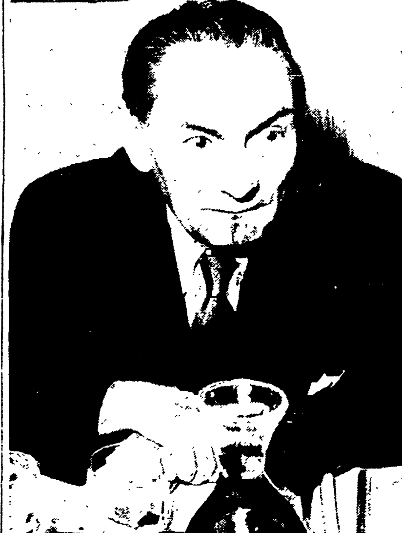
Una familiare immagine del grande regista sovietico Pudovkin