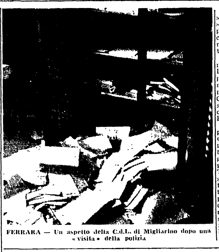
FERRARA - Un aspetto della C.A.L. di Migliorino dopo una visita della polizia.

Il grande sciopero agricolo della provincia di Ferrara, sul quale si era concentrata l'attenzione appassionata di tutto il Paese, si è concluso vittoriosamente. Raggiunto un accordo di massima nel colloquio con i dirigenti del ministero del Lavoro, tra i rappresentanti della CGIL e della Confederazione nazionale dei braccianti di Ferrara, da una parte, e quelli della Confederazione dell'Agricoltura, dall'altra, l'on. Vigorelli ha convocato ieri le parti, per il medesimo giorno, la firma dell'accordo, avvenuta in serata.