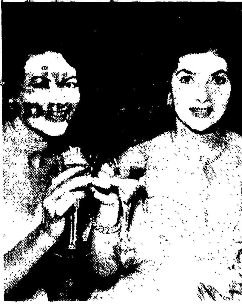
BERLINO — Gina Lollobrigida e Yvonne De Carlo s'innamorano in occasione del Festival cinematografico che ha avuto luogo nella città tedesca...