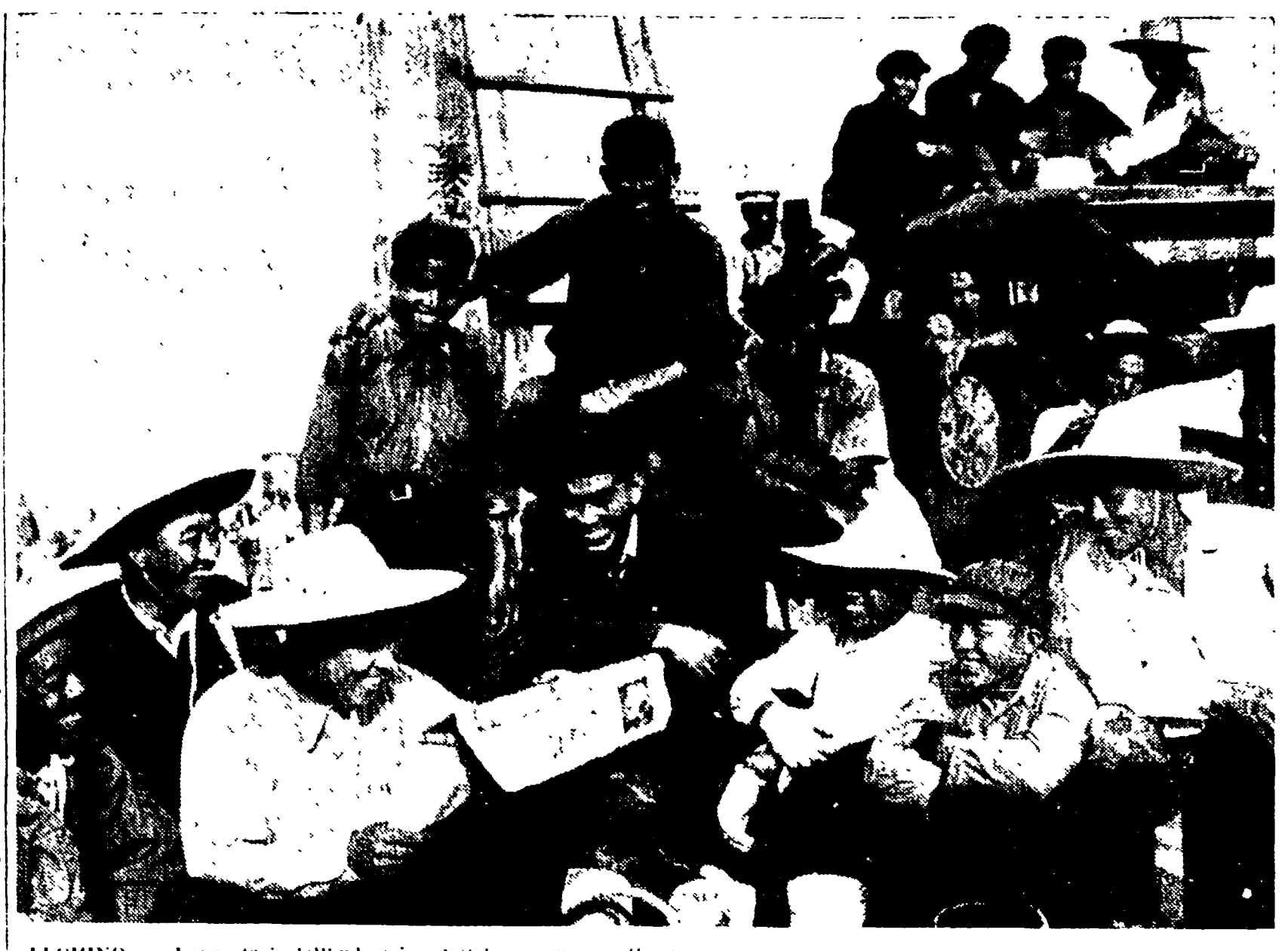
LECINO — Lavoratori dell'industria elettrica seguono attentamente sulla stampa i commenti e le notizie relativi alla approvazione del progetto di Costituzione cinese e alla stipulazione degli accordi di pace fra la Cina, l'India e la Birmania

«Giorgio Dimitrov fu un grande, non solo come comunista, come combattente proletario, ma anche come dirigente, come capo del movimento operaio socialista e comunista mondiale. Nella sua vita, nella sua lotta, nella sua opera, nella sua vita, nella sua lotta, nella sua opera...»