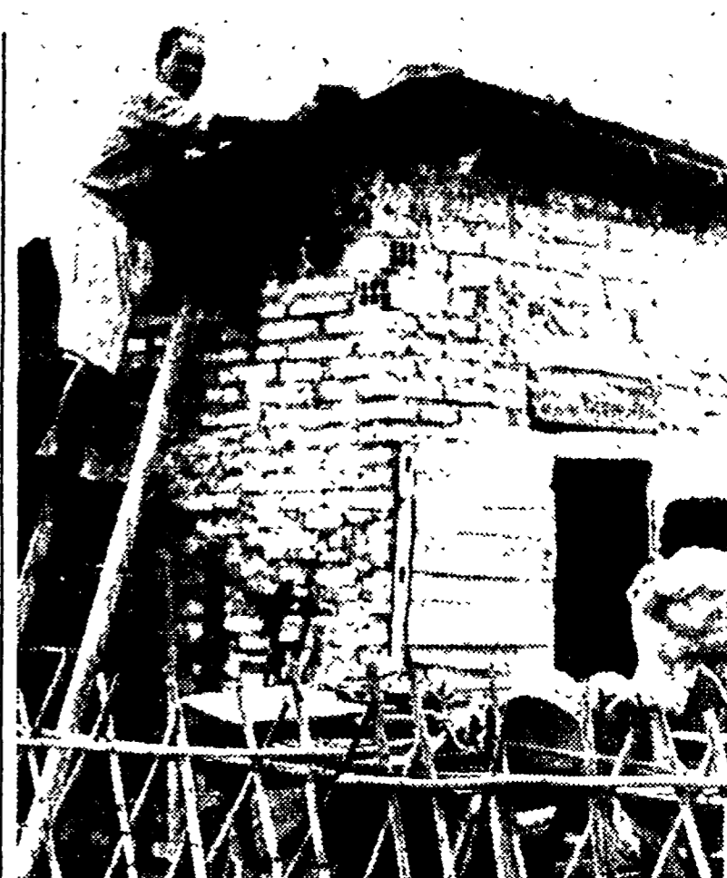
Come sempre quando imperversa il maltempo i baracati sono sottoposti a disagi indicibili. Ieri mattina, sotto un cielo grigio che prometteva nuova pioggia...