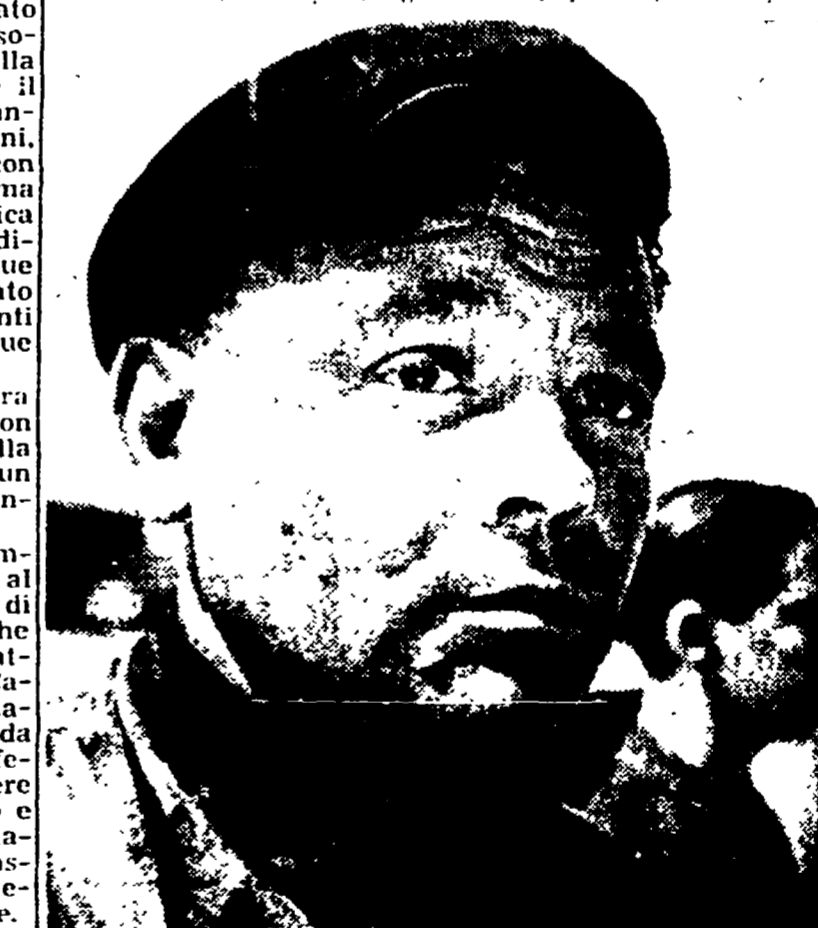
Anche a Roma sta per giungere finalmente «Operazione Apfelkern», il film di René Clément sulla Resistenza francese; mostriamo qui il volto vigoroso di uno dei protagonisti