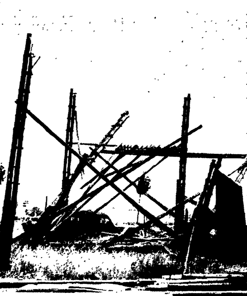
Nella giornata di ieri, è proseguita intensamente l'opera dei Vigili del Fuoco e dei privati per riparare ai danni causati dal ciclone e dalla pioggia dell'ultima sera...