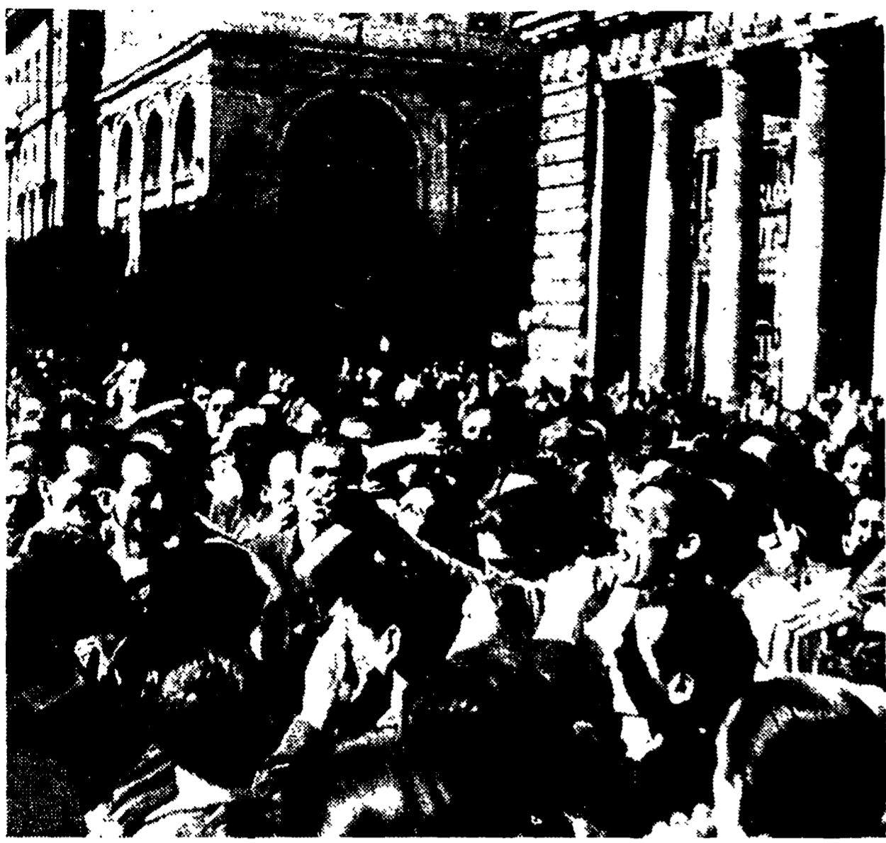
A sei anni di distanza, il ricordo del 14 luglio 1948 torna come quello di uno dei giorni più drammatici vissuti dal movimento popolare nel nostro Paese. Tutti i buoni italiani rammentano l'odioso attentato compiuto contro il capo del Partito comunista, il compagno Togliatti...