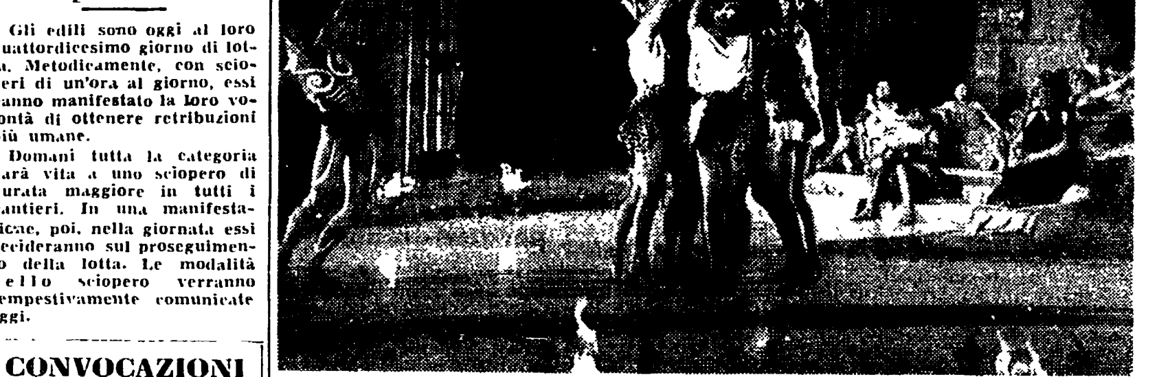
Una tipica scena esotica del «colosso» Elena di Troia. E' una inquadratura idilliaca — ma non tanto: guardate la ballerina sulle spade — il film, però, sembra destinato ad essere costellato di vittime

L'azione, e vola puramente mediante gigantesche impalcature, le mura della Città di Troia. La scena che il regista americano Robert Wise si apprestava a girare — doveva rappresentare l'assalto alla città — è stato condotto dai soldati Greci e da questi ultimi, dinanzi alla disperata difesa dei Troiani.