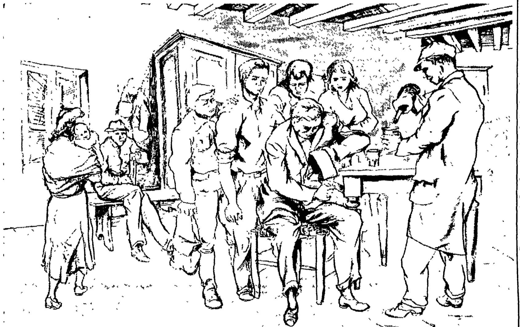
A un certo punto dissi: «Bene, ditemi voi che cosa raccontate...» (Disegno di Claudio Astoligo)