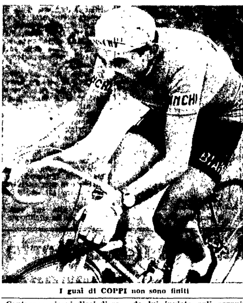
I guai di COPPI non sono finiti