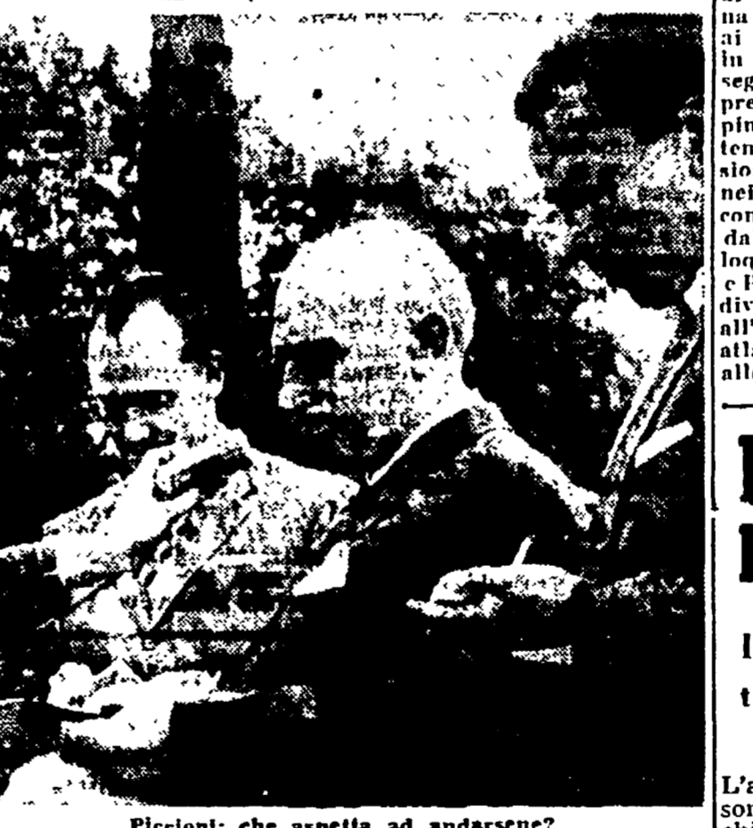
Piccioni: che aspetta ad andarsene?

TRENTINO, 16. — La neve ha fatto la sua prima comparsa sulle montagne del Trentino durante il nubifragio di ieri.