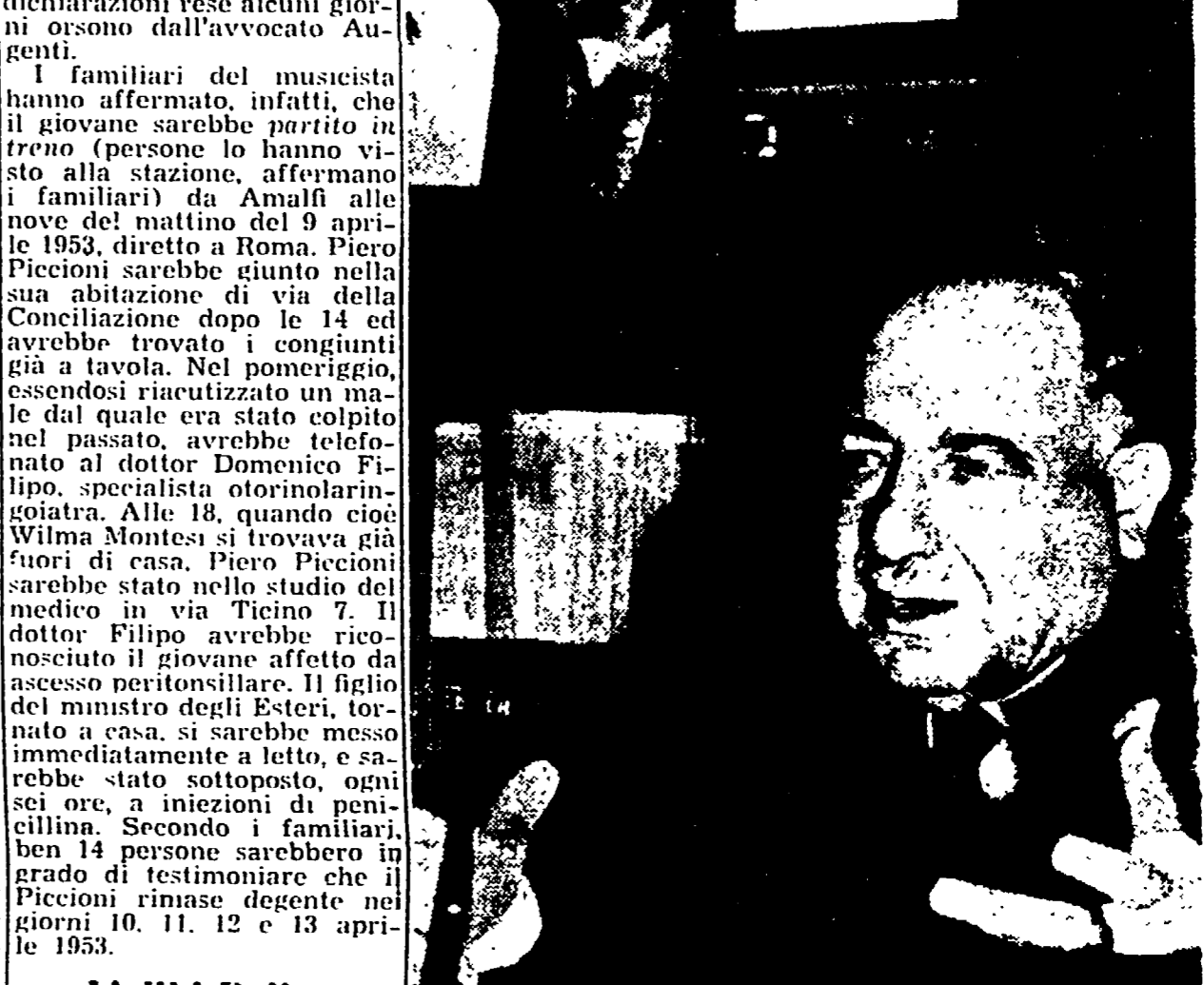
Secondo i Piccioni, Polito si sarebbe inventato il «suo» alibi sul figlio dell'attuale ministro degli Esteri

Mentre trascorrono i giorni in ansiosa attesa che il Procuratore generale, dottor Giocoli, porti a compimento l'esame degli atti relativi all'assassinio di Wilma Montesi, un nuovo documento viene a turbare le acque per quanto si riferisce ad uno dei personaggi più in vista della vicenda. Nella sala-stampetta Palazzo Marignoli, è stata fatta circolare ieri una velenosa, riprodotte i passi più notevoli di una dichiarazione concessa dai familiari di Piero Piccioni al settimanale "Oggi". Lo scritto illustra ampiamente un alibi del figlio del ministro degli Esteri, con affermazioni e circostanze che smentiscono le dichiarazioni rese alcuni giorni orsono dall'avvocato Augenti.