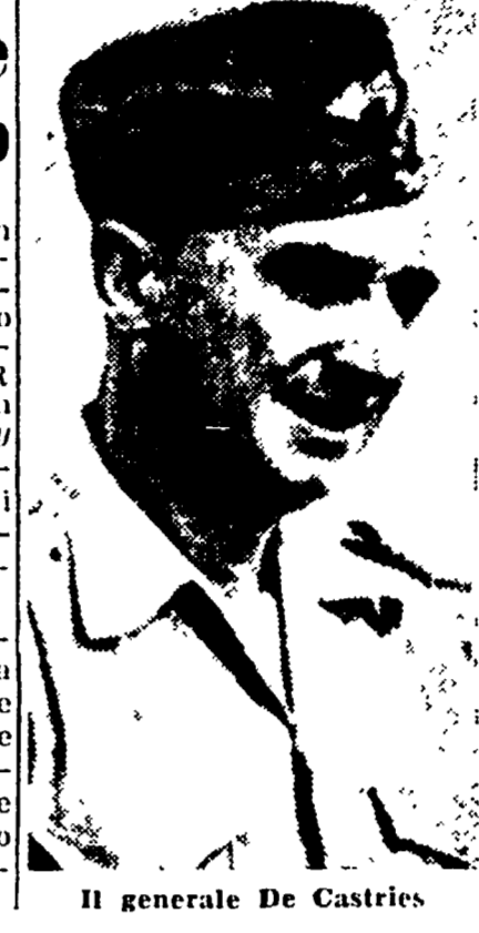
Il generale De Castries