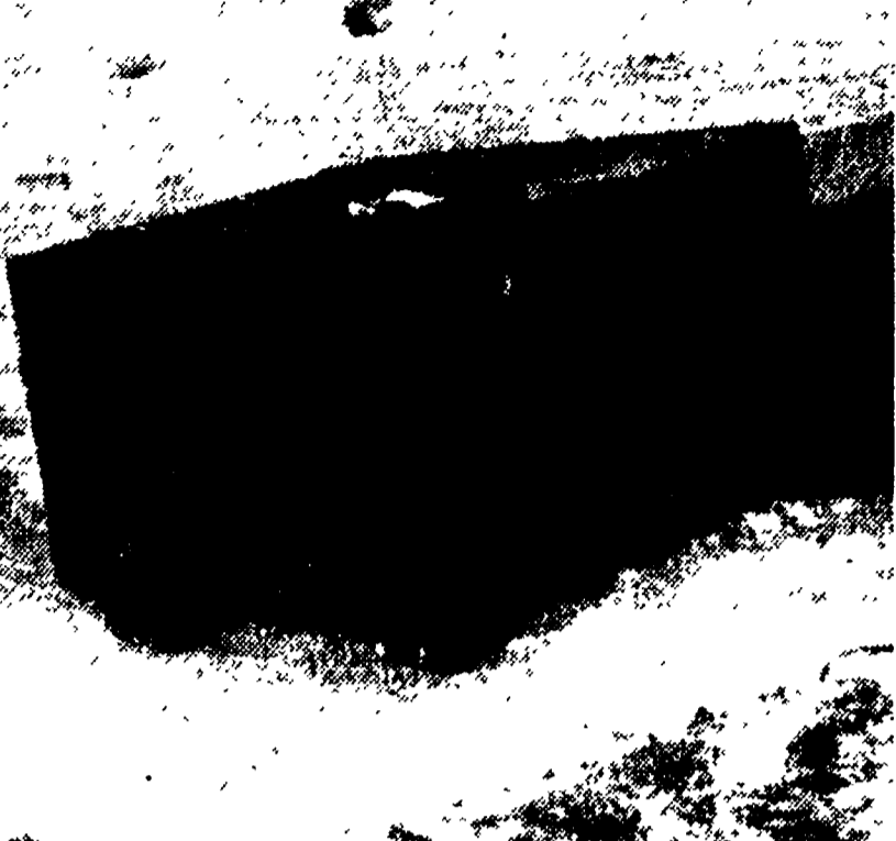
Relitti come questo visibili nella foto, disseminati sulla spiaggia fino ad Ostia, sono quanto resta del peschereccio «Febo»

Gli altri sette membri dell'equipaggio salvati dal pronto intervento di due marinai e del capitano del porto - Un'improvvisa tempesta è stata la causa della sciagura