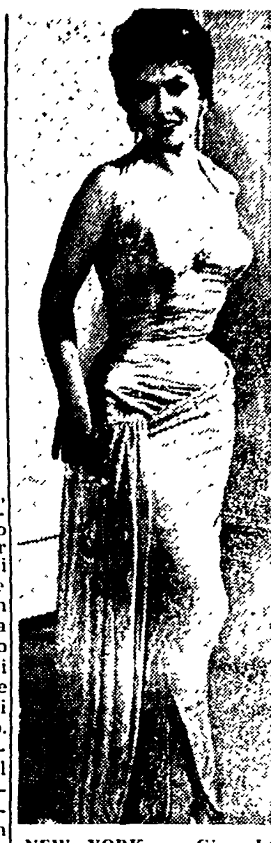
NEW YORK — Gina Lollobrigida nella metropoli americana...