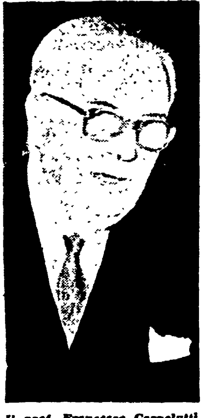
Il prof. Francesco Carnelutti