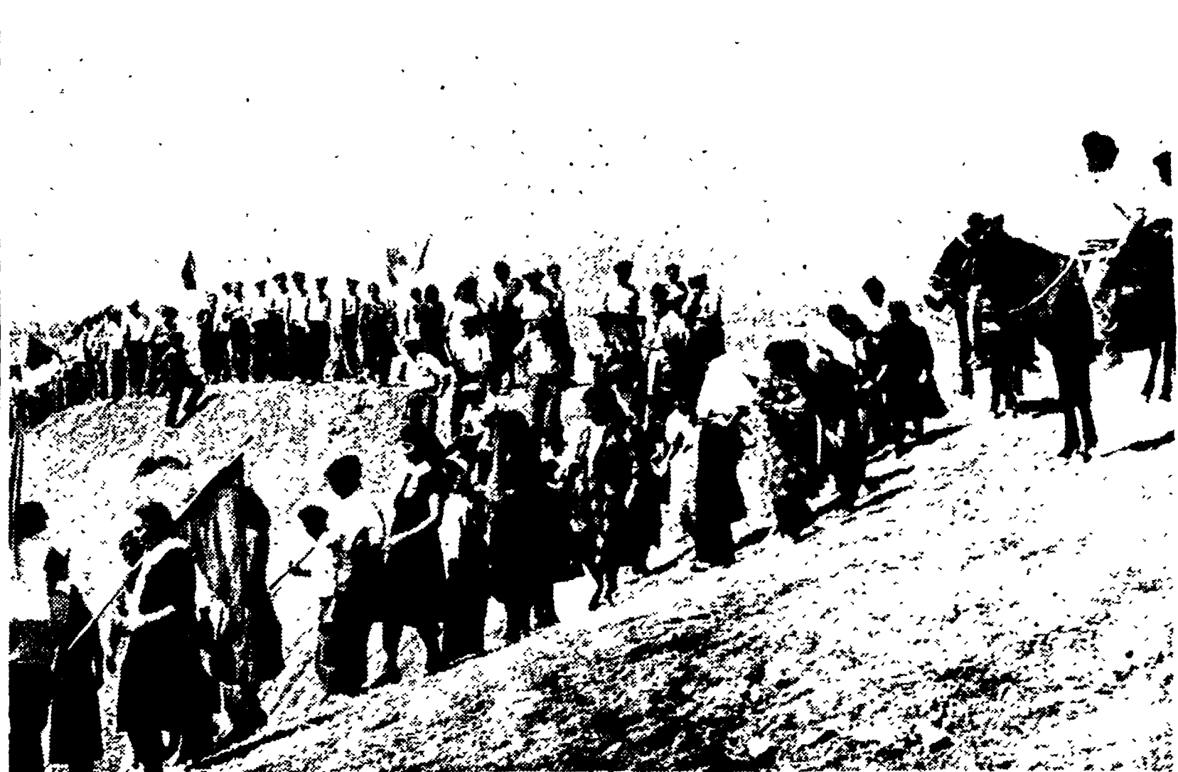
SICILIA — Ogni mattina, dal 5 settembre, uomini e donne di San Biagio Platani (Agrigento) si recano sui terreni della loro cooperativa...