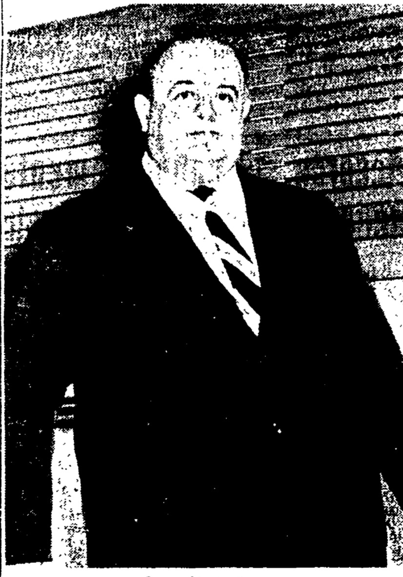
Il Presidente Sepe

Gli attacchi della stampa governativa - Anche il ministro De Pietro si inserisce nella campagna - L'ex fidanzato di Wilma di nuovo interrogato