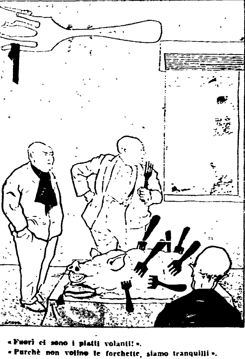
«Fuori ci sono i piatti volanti». «Perché non volino le forchette, siamo tranquilli».