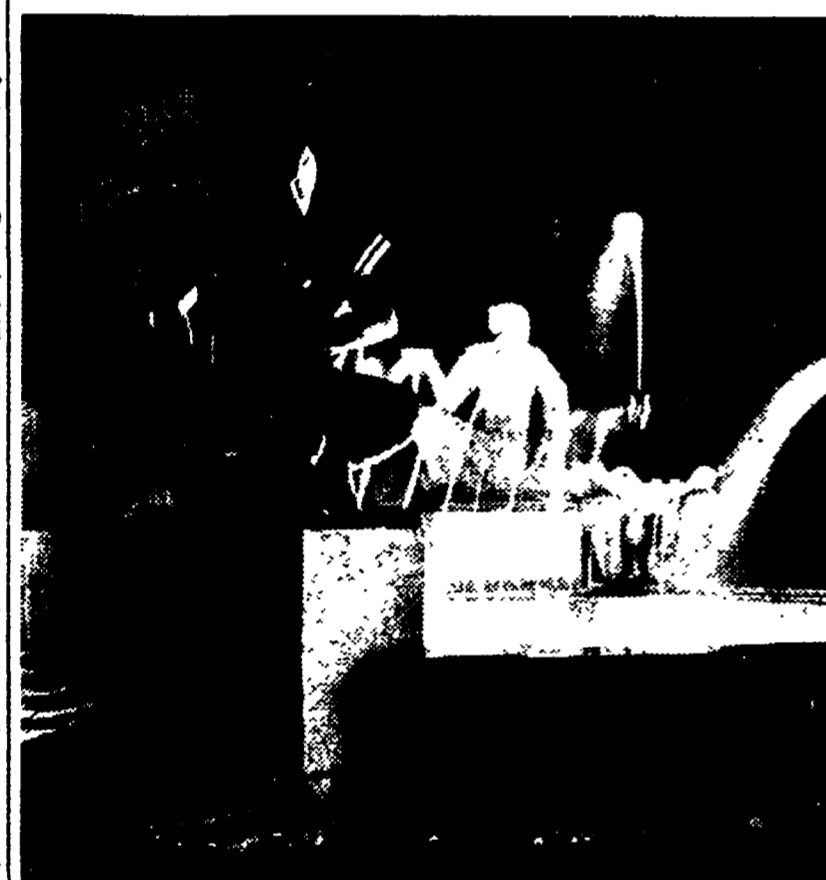
CALTAGIRONE - Nella cittadina natale di Scelba è stata eretta questa fontana dedicata all'avvocato che, il quale evidentemente non ha la modestia fra le sue doti principali. L'acqua comunque è un motivo ricorrente nella vita di Scelba, da Mussomeli a Salerno