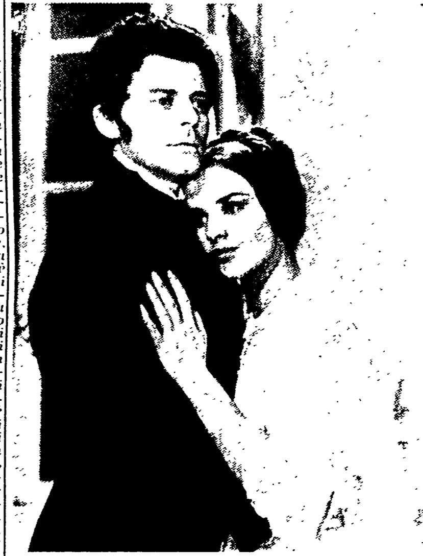
Gérard Philipe e Antonella Lualdi nel film «Il rosso e il nero»