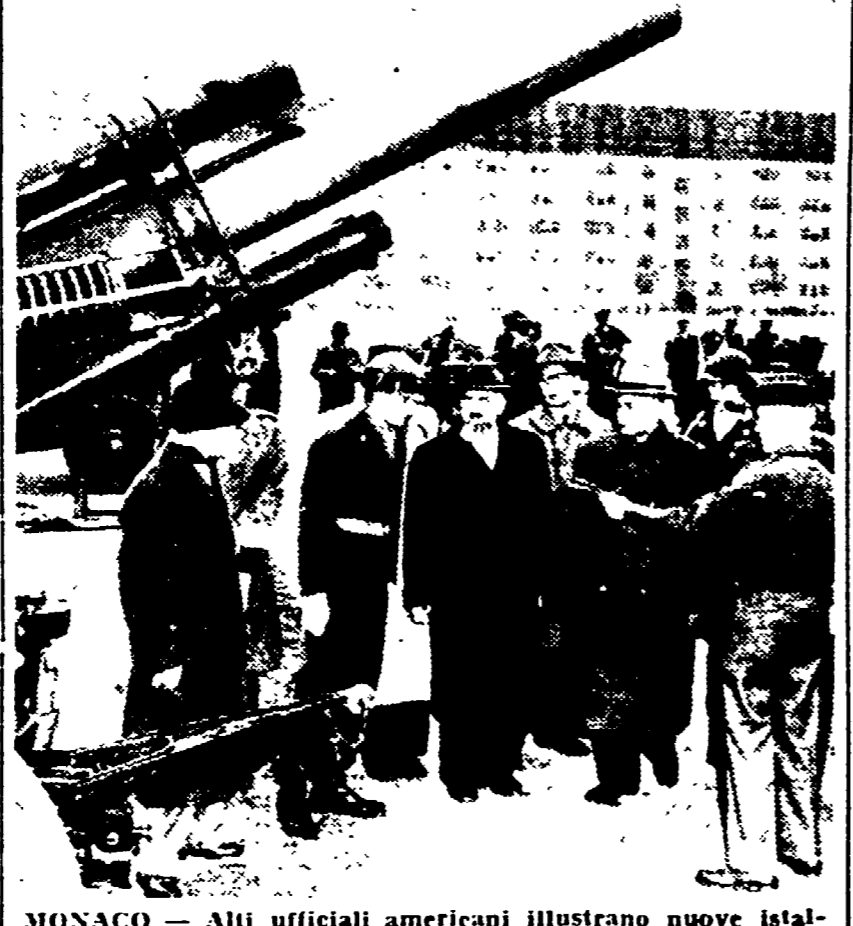
MONACO — Gli ufficiali americani illustrano nuove installazioni militari agli esponenti del governo bavarese