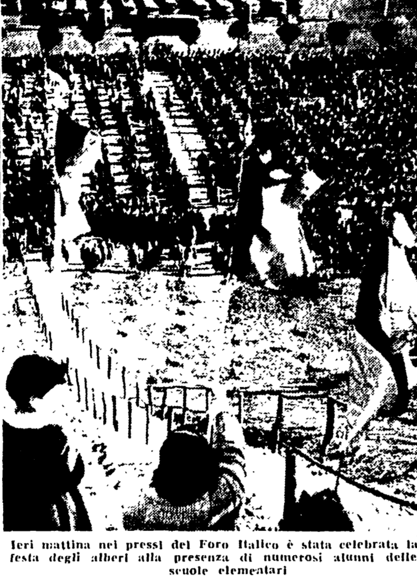
Ieri mattina nel pressi del Foro Italico è stata celebrata la festa degli alberi alla presenza di numerosi alunni delle scuole elementari

CONCLUSI I LAVORI DEL CONVEGNO DELLA C.D.L.