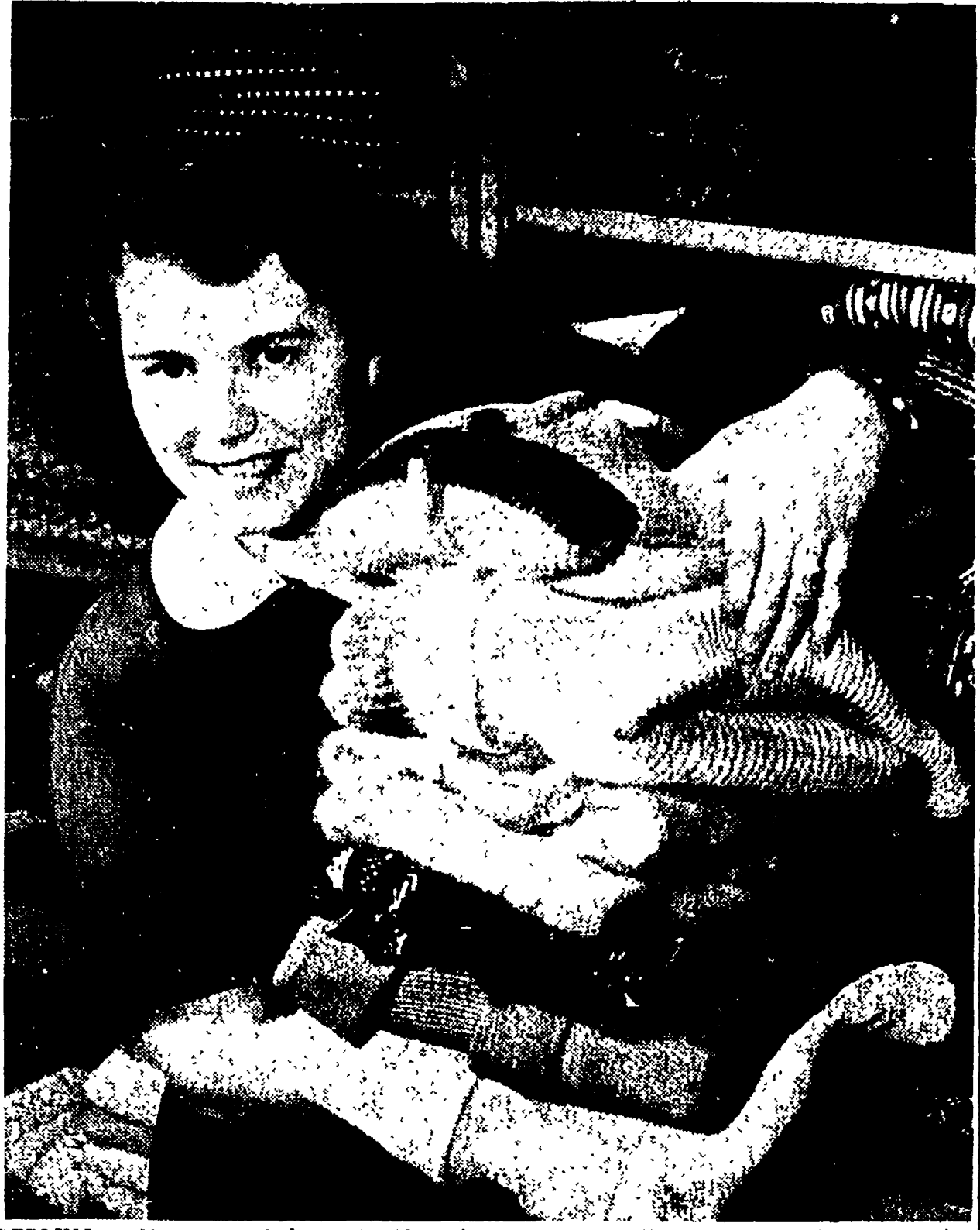
BERLINO — Nel negozio della H. O. (Organizzazione cooperativa del commercio), sono arrivate le ultime novità della moda invernale

L'antica origine della tradizione - Le ragazze di mezzodi - L'addio ad una spensierata gioventù