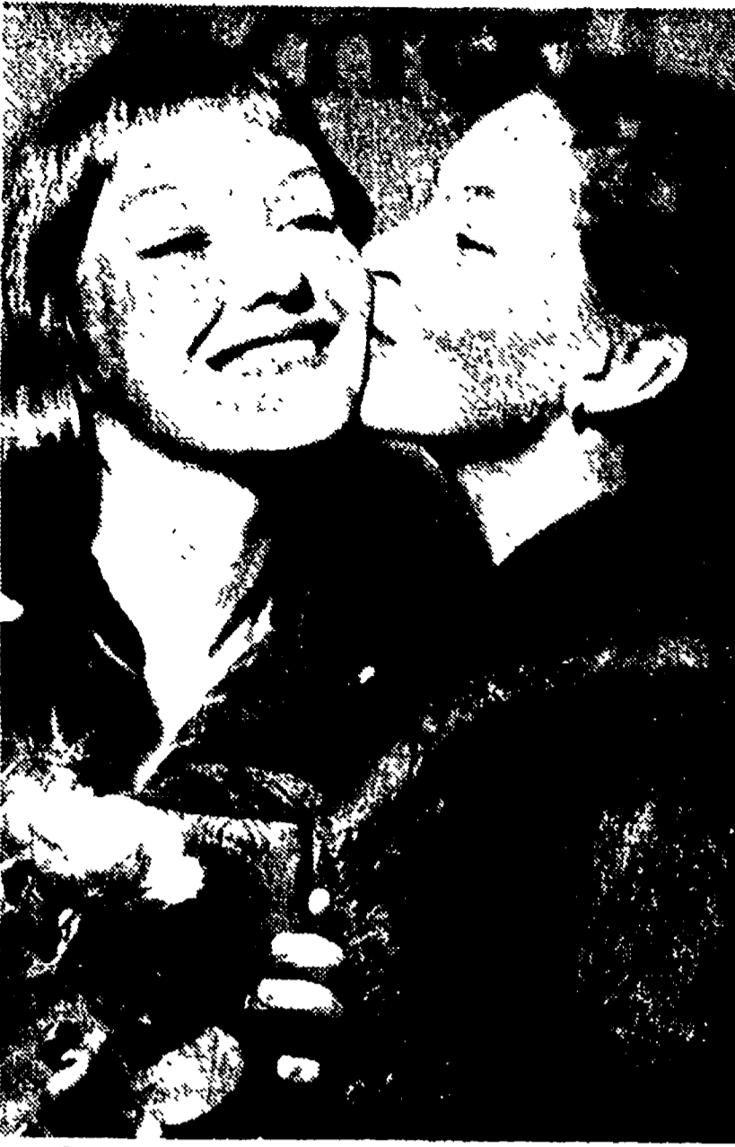
PARIGI — L'attrice Marine Vlady ha ottenuto per le sue interpretazioni cinematografiche il premio Suzanne Bianchetti...