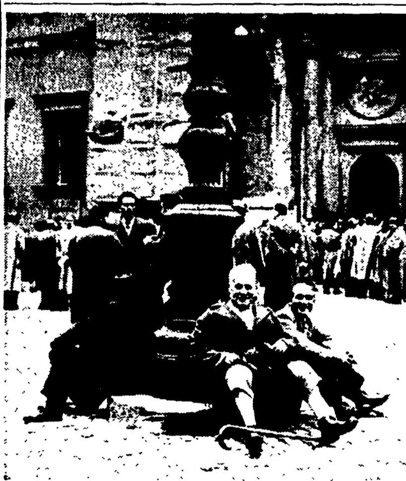
I mutilati a Montecitorio in attesa della risposta del governo alle loro richieste