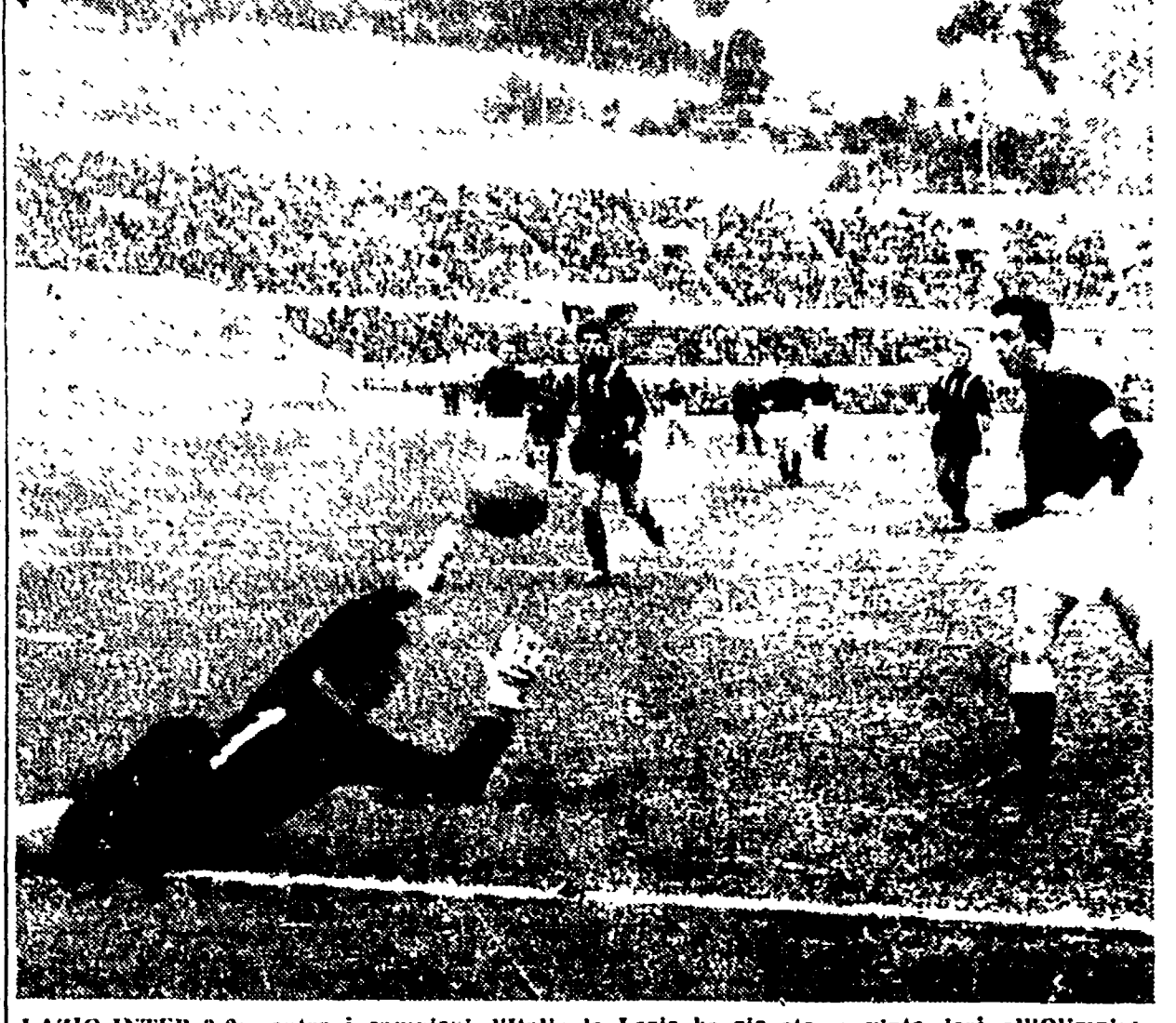
LAZIO-INTER 3-2; contro i campioni d'Italia la Lazio ha giocato e vinto ieri all'Olimpico...