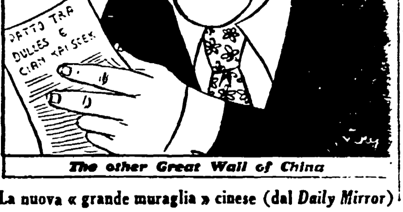
The other Great Wall of China

NEW YORK, 18. — Informazioni diffuse oggi da fonti ufficiali del pseudo governo di Chiang Kai-shek hanno reso noto che reparti dell'esercito popolare di liberazione cinese hanno liberato con una operazione antibia perfettamente riuscita l'isola di Yikiangscian, già guarnigione di nord-ovest di Taiwan (Formosa) e dodici miglia a nord-ovest di Tachen, la principale del gruppo di isole omonime, controllate dalle bande del Kuomindan.