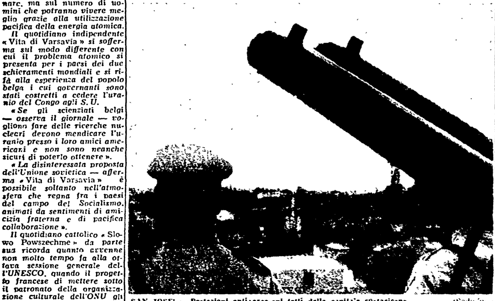
SAN JOSE - Postazioni anticeree sul tetto della capitale costaricana