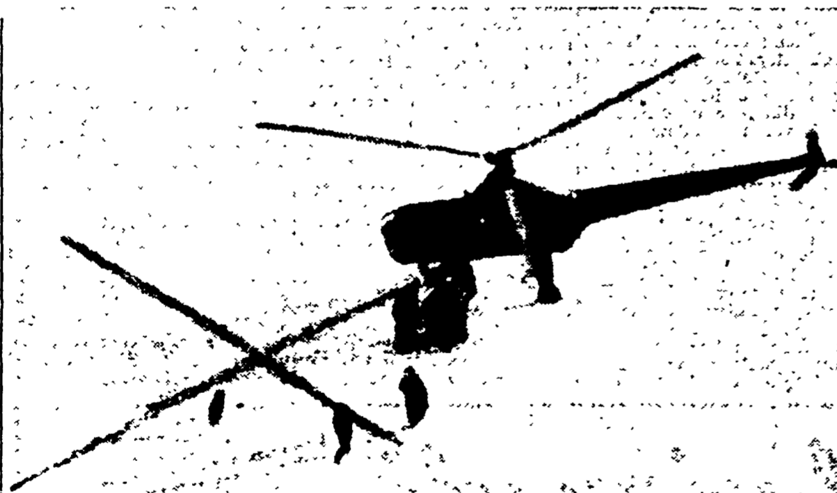
SCOZIA — Uno dei trenta elicotteri inviati con la portaerei «Glory» a recare i soccorsi alle decine di migliaia di abitanti isolati nell'«inferno bianco».

LONDRA, 19. — Una flotta di una trentina di elicotteri ed aerei è stata inviata oggi sull'«inferno bianco» della Scozia settentrionale, per paracadutarvi viveri e medicinali alle decine di migliaia di abitanti isolati in località bloccate dalla neve che ha imperversato per otto giorni. La situazione minaccia di aggravarsi, perché — per quanto la temperatura sia sensibilmente aumentata — altre abbondanti nevicate sono preannunciate sulla maggior parte delle isole britanniche e sull'Europa.