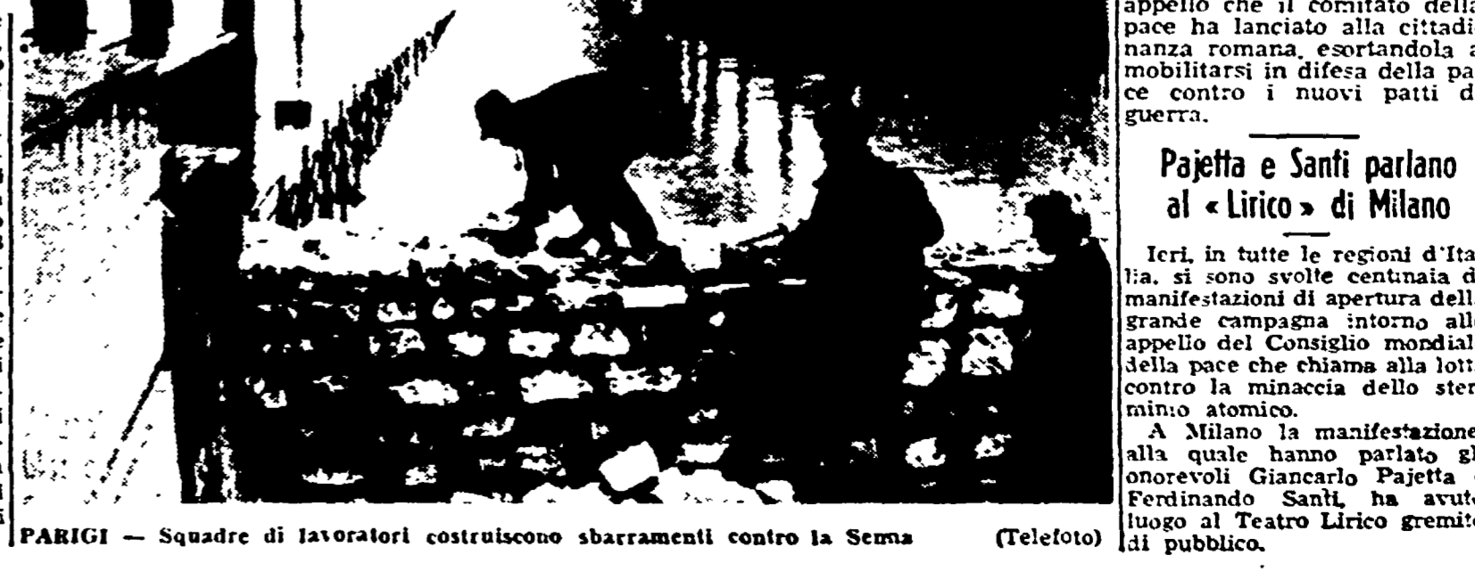
PARIGI - Squadre di lavoratori costruiscono sbarramenti contro la Senna

PARIGI, 23. - La vallata della Senna è oggi virtualmente ridotta ad un immenso acquitrino giallastro. La piena ha inondato ogni abitabile e conducono alla capitale francese e quattordici chilometri ai lungofiume all'interno di essa. L'acqua toccherà entro domani il livello record del 1924.