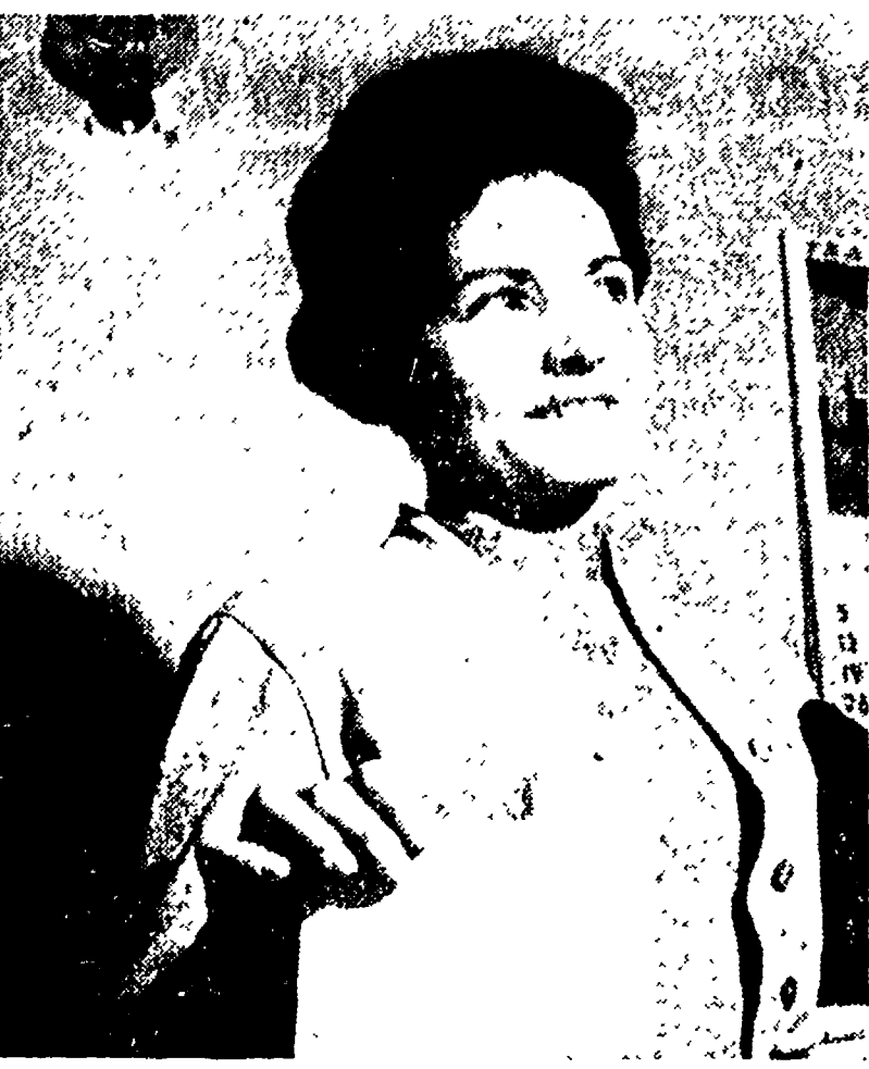
Una elettrice consegna la sua volontà al segreto dell'urna. L'esercizio del diritto di voto ha aperto alle donne italiane le vie maestose dell'emancipazione.

« Ci è mancato poco che andassimo a manifestare come delle suffragiste al Viminale, per chiedere il suffragio universale nel più lontano 45. Eravamo pronte a farlo con una grande manifestazione. Non facemmo nulla, perché giunse la grande notizia del riconoscimento di questo diritto, che veniva riconosciuto alle donne come conseguenza della riconquistata libertà del popolo italiano, libertà conquistata a prezzo di dure ed eroiche lotte contro il fascismo, i repubblicani, i nazisti. Tutte alle quali le donne italiane avevano saputo dare il loro contributo », dice la on. Giuliana Nenni, accomiatandosi da noi.