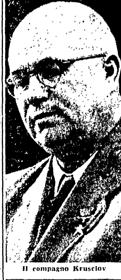
Il compagno Krusiov

tedeschi come un contributo di grande valore per le manifestazioni delle rispettive posizioni in quanto ribadisce in termini che non lasciano posto ad equivoci, l'intenzione dell'URSS di accettare un controllo internazionale sulle elezioni nei termini proposti da Eden alla conferenza di Berlino. Su questo punto, non è impossibile raggiungere un accordo anche prima che venga convocata ed aperta una nuova conferenza a quattro. L'accordo, si osserva ancora negli ambienti di Bonn, è di grande importanza e può anche considerare raggiunto a priori sul problema della legge elettorale tedesca che dovrà venire elaborata tenendo conto dei precedenti leggi, molto simili, preparate a questo fine nel 1952, dalla Camera del Popolo e dal Bundestag.