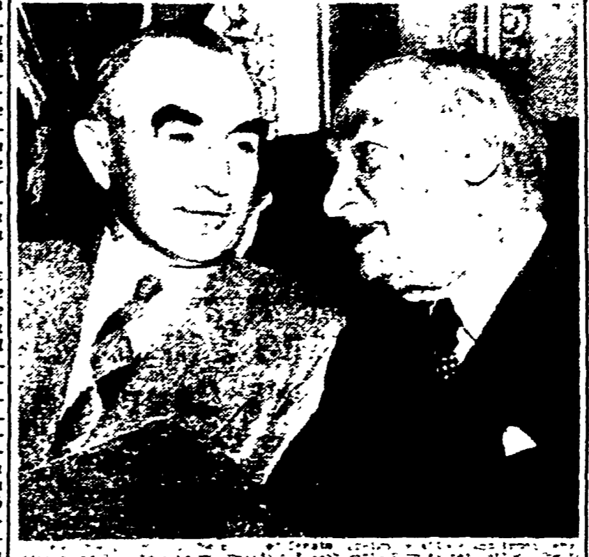
WASHINGTON — I senatori americani Wayne Morse (indiretto) e Langer, che hanno votato contro la richiesta di Eisenhower di essere autorizzato a scatenare un intervento militare contro la Cina. Morse ha dichiarato domenica che la richiesta di Eisenhower è una resa alla teoria della guerra preventiva sostenuta dall'ammiraglio Radford

la questione, ma al contrario un continuo affluire di nuove forze americane e informazioni diffuse da autorevoli organi di stampa, si è reso necessario di portare la tensione a un livello ancora più alto. E' stato annunciato da Taipei che l'intero diciottesimo gruppo americano di cacciatori di stanza a Taiwan, un gruppo di due squadriglie era giunto là da Okinawa giovedì scorso, e che un altro gruppo di due squadriglie di stanza a Taiwan entro pochi giorni. Dalla base di Clark, nelle Filippine, un altro gruppo di cacciatori di stanza a Taiwan, il gruppo «O.N.U.» è chiamata ad occuparsi. Non solo, infatti, in quelle attività non si è avuto un segno di diminuzione da quando il Consiglio di Sicurezza è stato investito del-