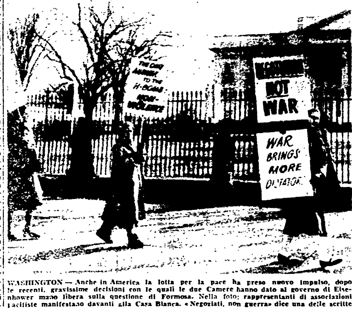
WASHINGTON - Anche in America la lotta per la pace ha preso nuovo impulso, dopo le recenti, gravissime decisioni con le quali il due Camere hanno dato al governo di Eisenhower mano libera sulla questione di Formosa. Nella foto: rappresentanti di associazioni pacifiste manifestano davanti alla Casa Bianca. «Negozianti, non guerra» dice una delle scritte.