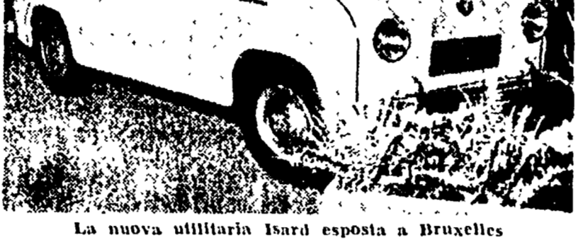
La nuova utilitaria Isard esposta a Bruxelles