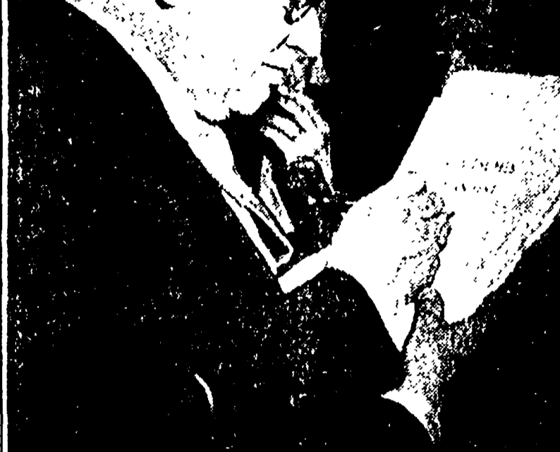
FRANCOFORTE — Adenauer mentre firma il manifesto contro il riarmo

Grande risonanza dell'articolo delle «Isvestia» - Adenauer scende in campo nel tentativo di limitare i successi socialdemocratici