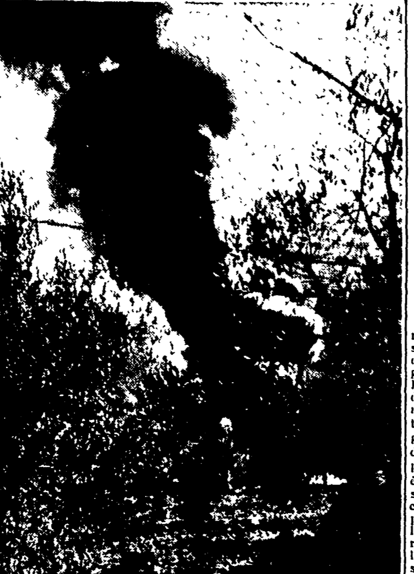
ALANO (Pesara) — Mille tonnellate di petrolio misto a fango e a detriti rocciosi sono state date alle fiamme presso il pozzo «Cigno N. 1» per scongiurare il pericolo di un'esplosione o di un'intendito di questa operazione, i lavori sono finiti. Il pozzo è pronto per la produzione commerciale