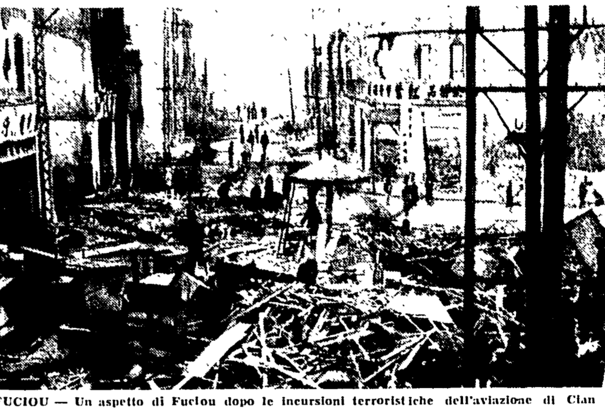
FUCIOU — Un aspetto di Fuciou dopo le incursioni terroristiche dell'aviazione di Cian

confermiamo con nuovo vigore la completa unità di vedute dell'URSS e della Repubblica popolare cinese, se nel campo della cooperazione fra i due Stati, sia in relazione alle questioni concernenti la situazione internazionale, l'amicizia cino-sovietica che l'amicizia cino-sovietica è un baluardo di pace in Estremo Oriente e nel mondo intero. L'agenzia americana, AP riferisce, ancora, il testo di una dichiarazione dell'ufficio di informazione sovietico, che dice: «L'Unione sovietica appoggia interamente la Repubblica popolare cinese nella sua lotta per l'unificazione del territorio cinese. La dichiarazione, nella versione fornita dall'agenzia, — Essa appoggia energicamente la richiesta della Repubblica popolare cinese per il ritiro delle truppe americane dal territorio delle isole Pescadore e dallo stretto di Formosa, e per la cessazione dell'aiuto americano alla critica antipopolare di Ciu Kai-seck».