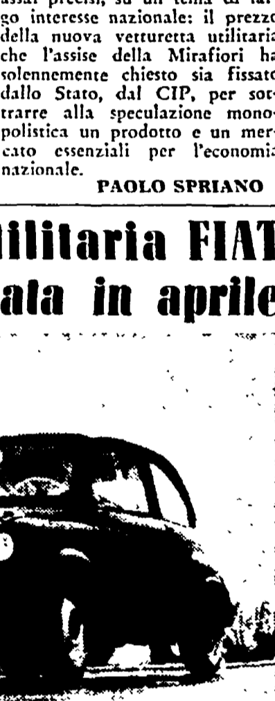
La nuova utilitaria FIAT: gli operai della Mirafiori hanno chiesto che il prezzo della macchina sia fissato dallo Stato...