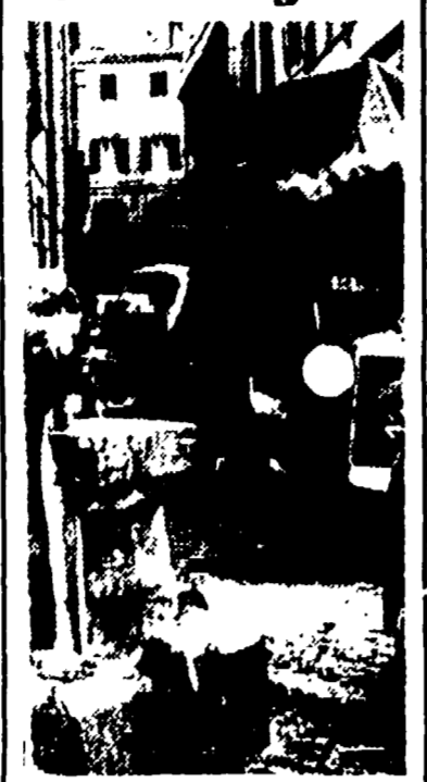
Un'ordinanza del sindaco ha confermato ieri il senso unico di marcia in via Margutta e ha istituito il divieto di sosta su ambo i lati della strada. È questo il primo successo della battaglia in difesa della tradizione stradale romana e del suo suggestivo ambiente.

UN PROBLEMA A CUI BISOGNA PENSARE FIN DA ORA