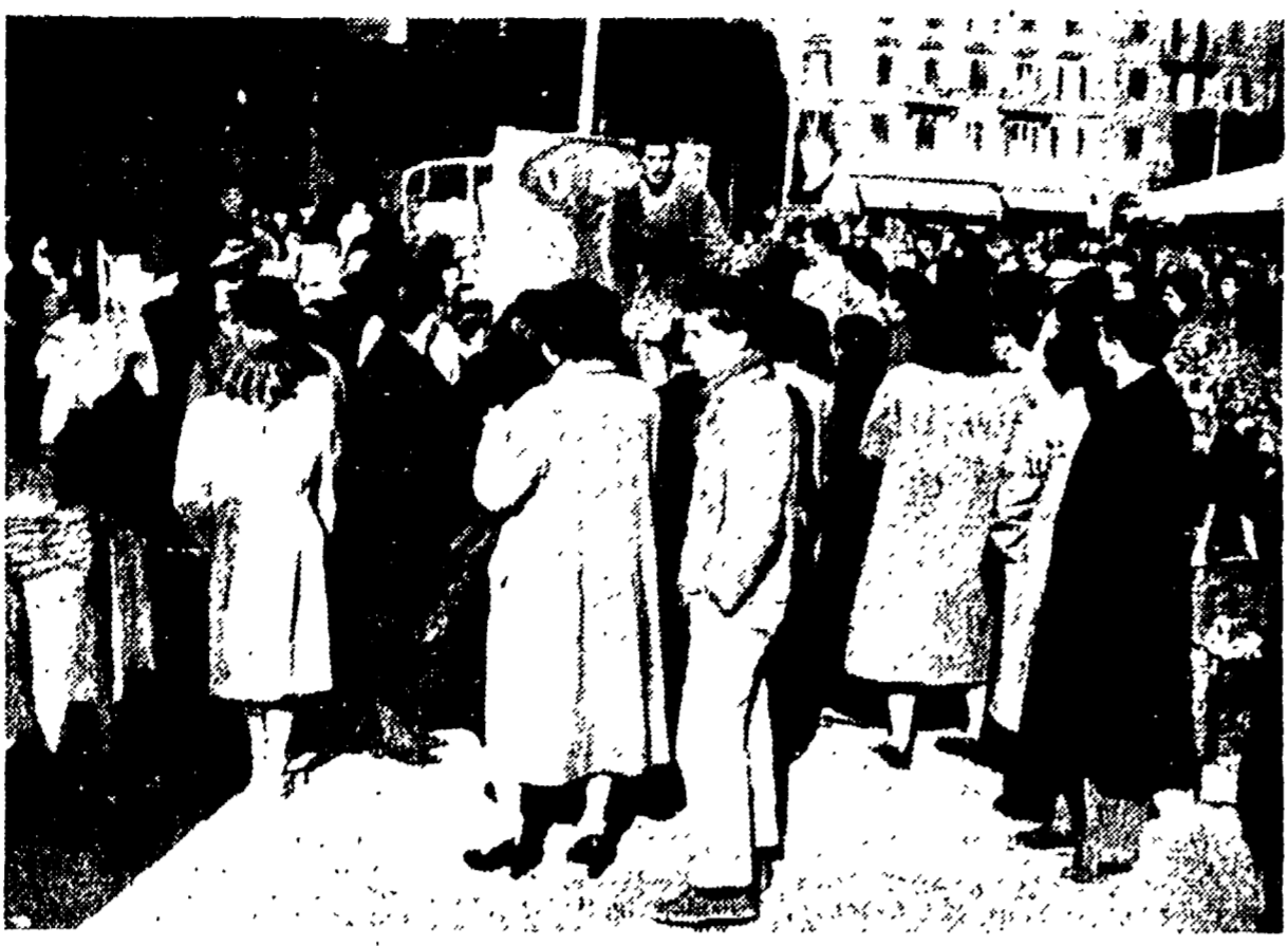
Le manifestazioni contro l'UEO a Roma. Un oratore improvvisato parla ai cittadini nel quartiere « Appio », nel corso di un comizio volante

Il movimento popolare contro il riarmo della Germania di Bonn e per la distruzione delle atomiche, si va sviluppando in tutto il Paese con un crescendo che già da queste battute iniziali fa prevedere un successo senza precedenti. Anche ieri nei rioni e nelle borgate di Roma gruppi di cittadini si sono raccolti intorno ai fogli di dieci svastiche naziste. I simboli del militarismo tedesco sono stati bruciati in Centocelle alla borgata Alessandrina, a via delle Acacie, all'angolo di via dei Saggi; all'Appio a Piazza Finocchiaro Aprile, all'Alberone, a piazza Scipione Ammirato, a Via Cesare Baronio, a via Furio Camillo, e a Montecitorio e Borgata Gordiani. Ovunque ai cittadini sono stati distribuiti volantini contro l'UEO. A Civitavecchia i lavoratori del molino Assisiani hanno scioperato per mezz'ora per manifestare la loro volontà di salvaguardare la pace.