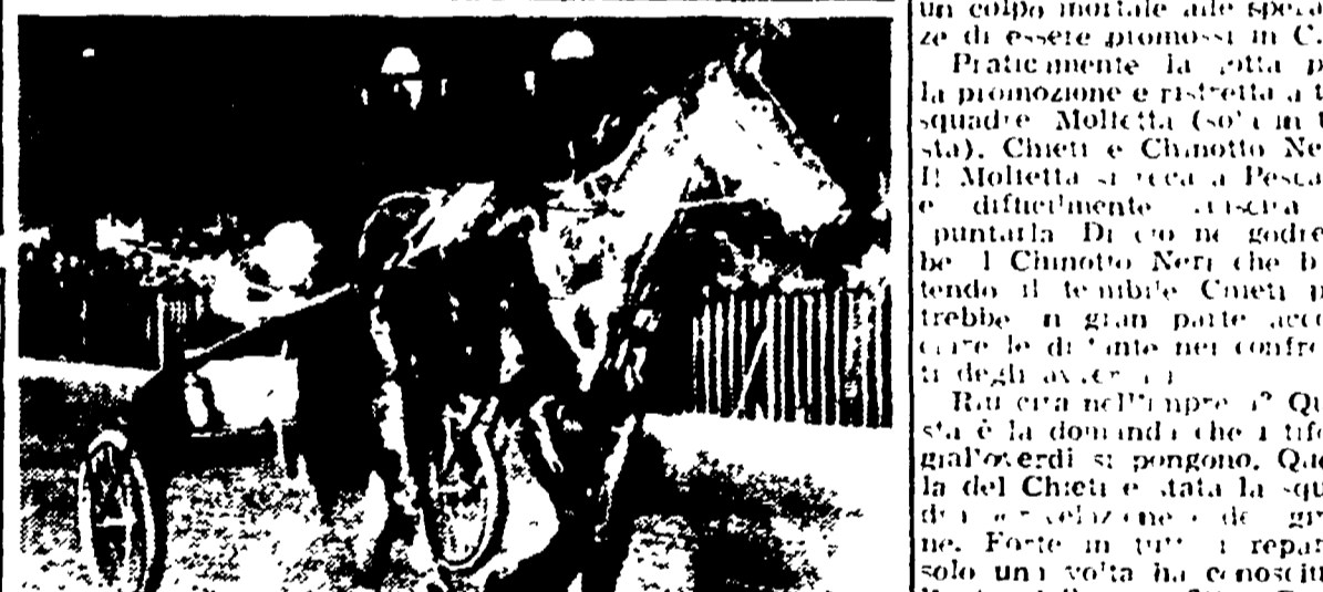
HIT SONG il trottolatore volante

La pista romana di Villa Glori, ospiterà oggi la prima prova internazionale di trotto, il tradizionale Premio Capannelle. Il match si è svolto al Boston Garden alla presenza di 12.000 spettatori. Il combattimento è durato 10 round, con un pareggio.