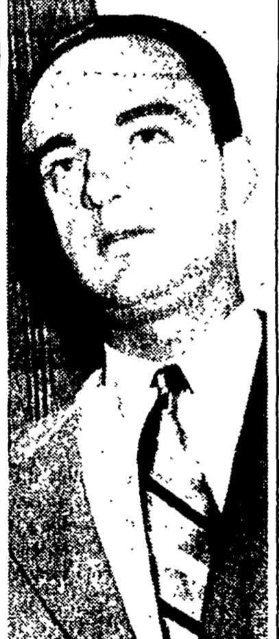
Roy Cohn, il luogotenente del sen. Mc Carthy

Ogni giorno si hanno nuovi sinistri segni del complottismo americano contro tutti i distintamente i popoli asiatici. E' di ieri l'altro il sequestro a Ginkarta di un carico di cannoni anticarro e antierei che, a bordo di una nave statunitense, erano destinati alle bande cinesi in quell'arcipelago contro il governo indonesiano. E' di ieri la notizia, data dalla stampa indiana, che agenti americani manovrano per rovesciare il governo dell'Afghanistan, col generale, agli occhi del Dipartimento di Stato, di essersi rifiutato di aderire al patto turco-pakistano. Di giorno in giorno i paesi dell'Asia imitano sempre meglio a individuare negli Stati Uniti il principale nemico della comune loro indipendenza e della loro pace, e alla luce della loro esperienza non possono non identificare con la propria lotta la lotta della Cina per liberare Taiwan.