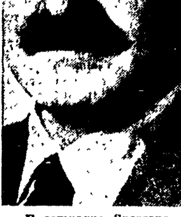
Il compagno Spezzano