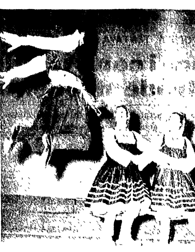
PARIGI — Il Balletto nazionale greco, per la prima volta in Francia...