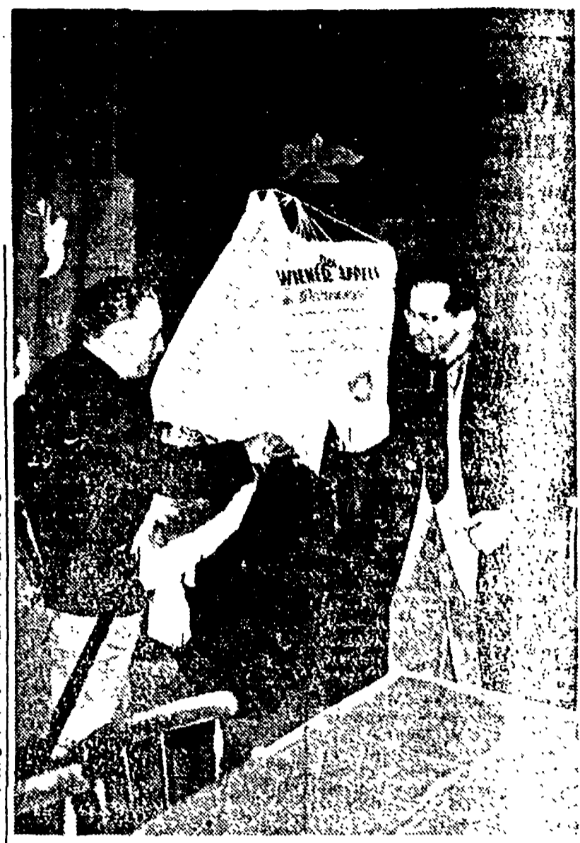
VIENNA - La raccolta delle firme contro la strage atomica nella capitale austriaca dove l'Appello è stato lanciato: l'aspetto di una manifestazione alla fabbrica Reberger