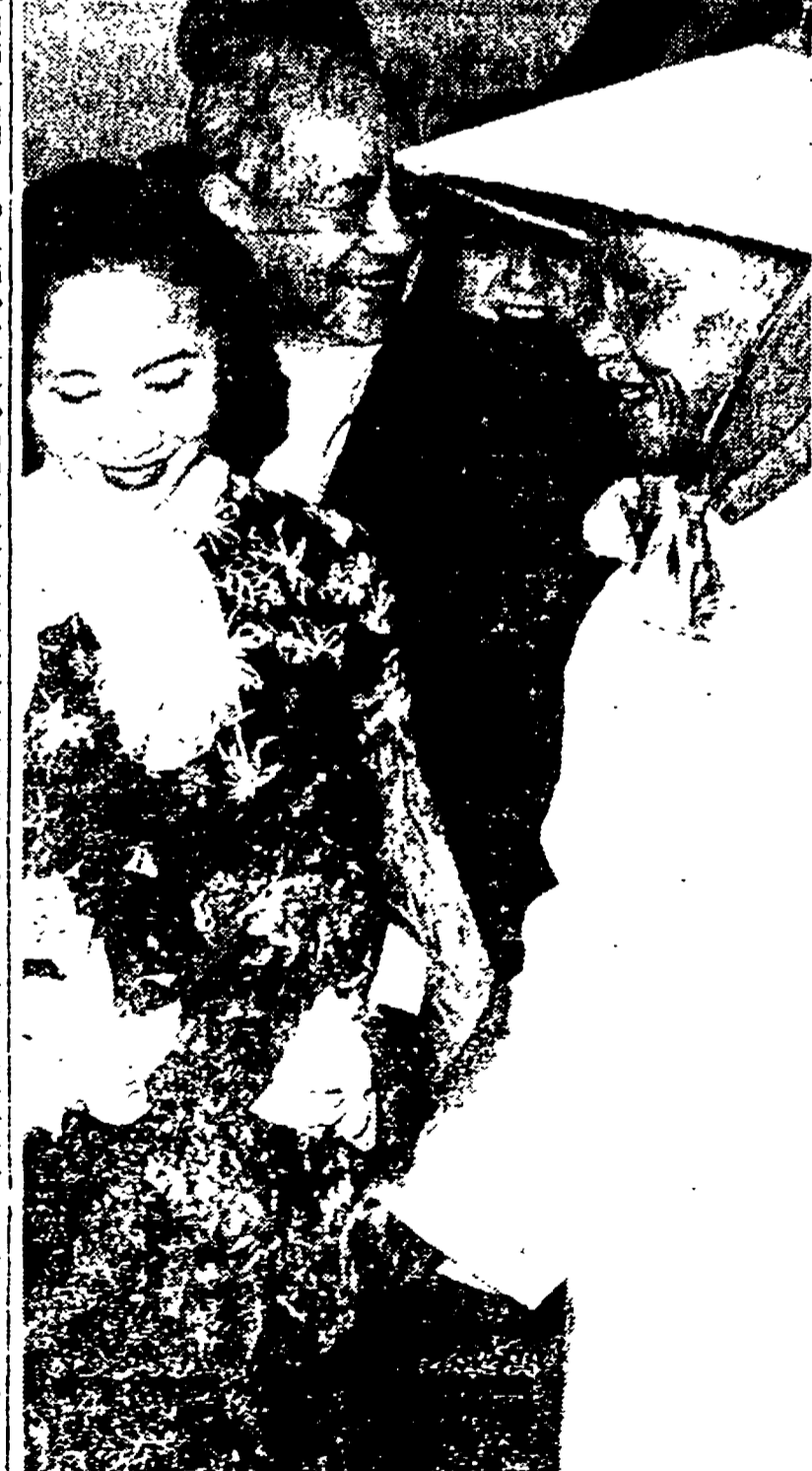
Phan Long Tac, il papa del caodaismo, una delle sette religiose che si dividono il potere nel Viet Nam meridionale