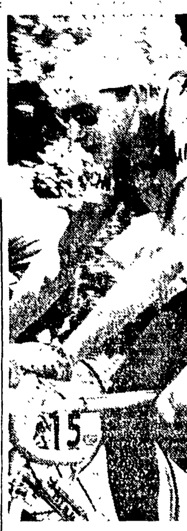
FAUSTO COPPI tiene molto al traguardo di Sanremo ma nella « corsa più bella del mondo », a contrastargli il passo saranno in tanti. Riuscirà Fausto a vincere lo stesso?