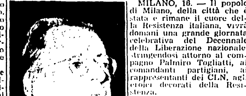
Il segretario generale del Pci, Togliatti, parla al convegno...