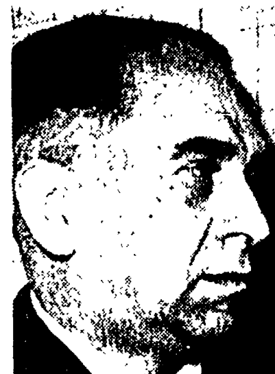
Il compagno Longo