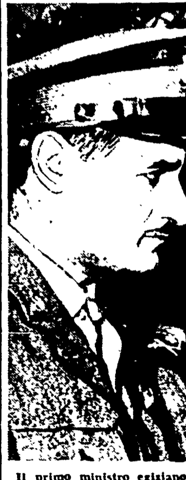
Il primo ministro egiziano Nasser

Il giorno Akhbar El Ion informa che il governo cinese ha offerto di acquistare grandi quantità di cotone egiziano, e afferma che « negoziati in proposito hanno avuto inizio il mese scorso durante la visita a Berlino orientale del comandante dell'aviazione Hassan Ibrahim, membro del Consiglio della Rivoluzione egiziana ».