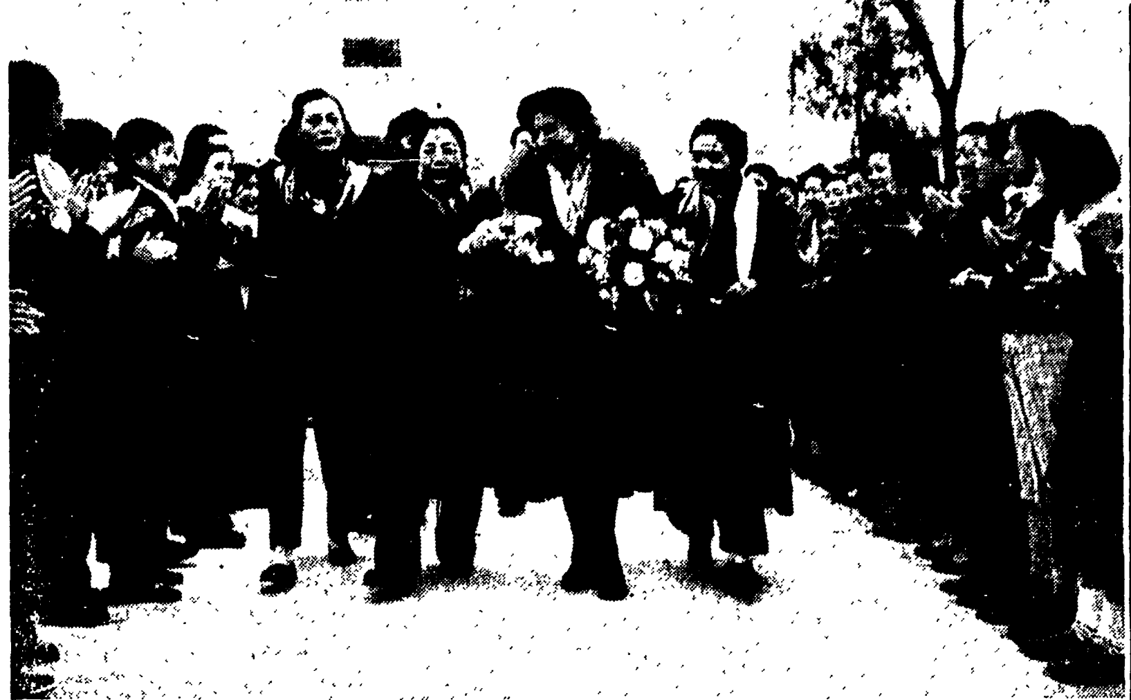
Eugenie Cotton, presidente della Federazione Internazionale delle donne democratiche, al suo arrivo a Pechino il 22 scorso. Sono a rievolvere Tsai Chang (prima a sinistra) e Teng Ylang (seconda a sinistra) che, segretaria e vice-segretaria della Federazione delle donne cinesi. Della Cotton è il discorso introdotto al 5. Consiglio dell'U.D. nel quale ella ha proposto il Congresso mondiale delle madri contro la guerra. In Italia l'8 maggio prossimo sarà dedicato alla preparazione di questo grande momento mondiale della difesa della pace