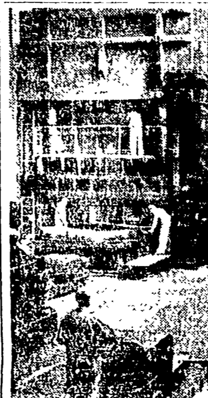
TORINO — L'officina numero cinque (reparto laminato) nello stabilimento FIAT Mirafiori

Di questa, a dir tutto a costoro. Sola su questa base a un-