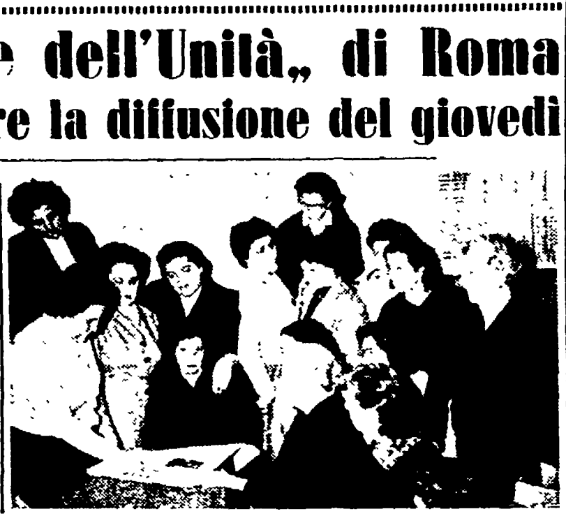
Si stanno svolgendo a Roma in questi giorni, organizzati dall'Associazione «Amici dell'Unità», incontri di compagnie delle varie sezioni per discutere i problemi della diffusione del giovedì. Sono scambi di esperienze per trovare insieme i mezzi organizzativi che possono portare ad un aumento di diffusione ogni giovedì.