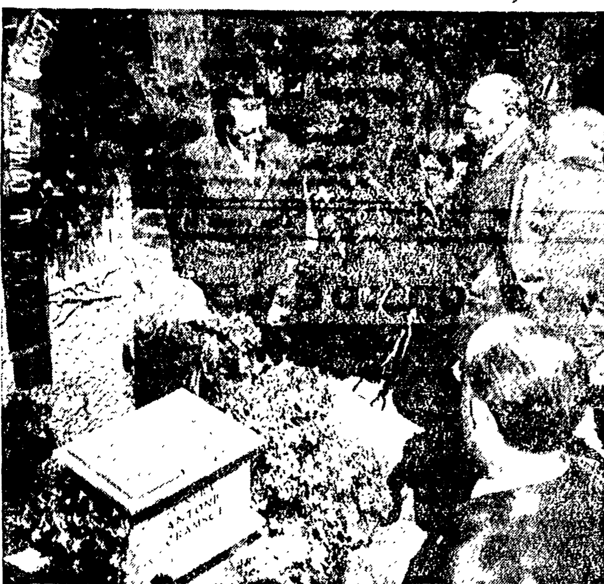
Ieri, nella ricorrenza del diciottesimo anniversario della morte di Antonio Gramsci, i compagni della Segreteria del PCI, del Comitato centrale, della Federazione romana e delegazioni dell'istituto di economia, dell'ANPPI e dell'ANPPIA hanno reso omaggio, al cimitero degli Inglese, al luogo della tomba di Gramsci. I compagni Togliatti, Longo (di spalle) e Scelbino sono presso la tomba di Gramsci