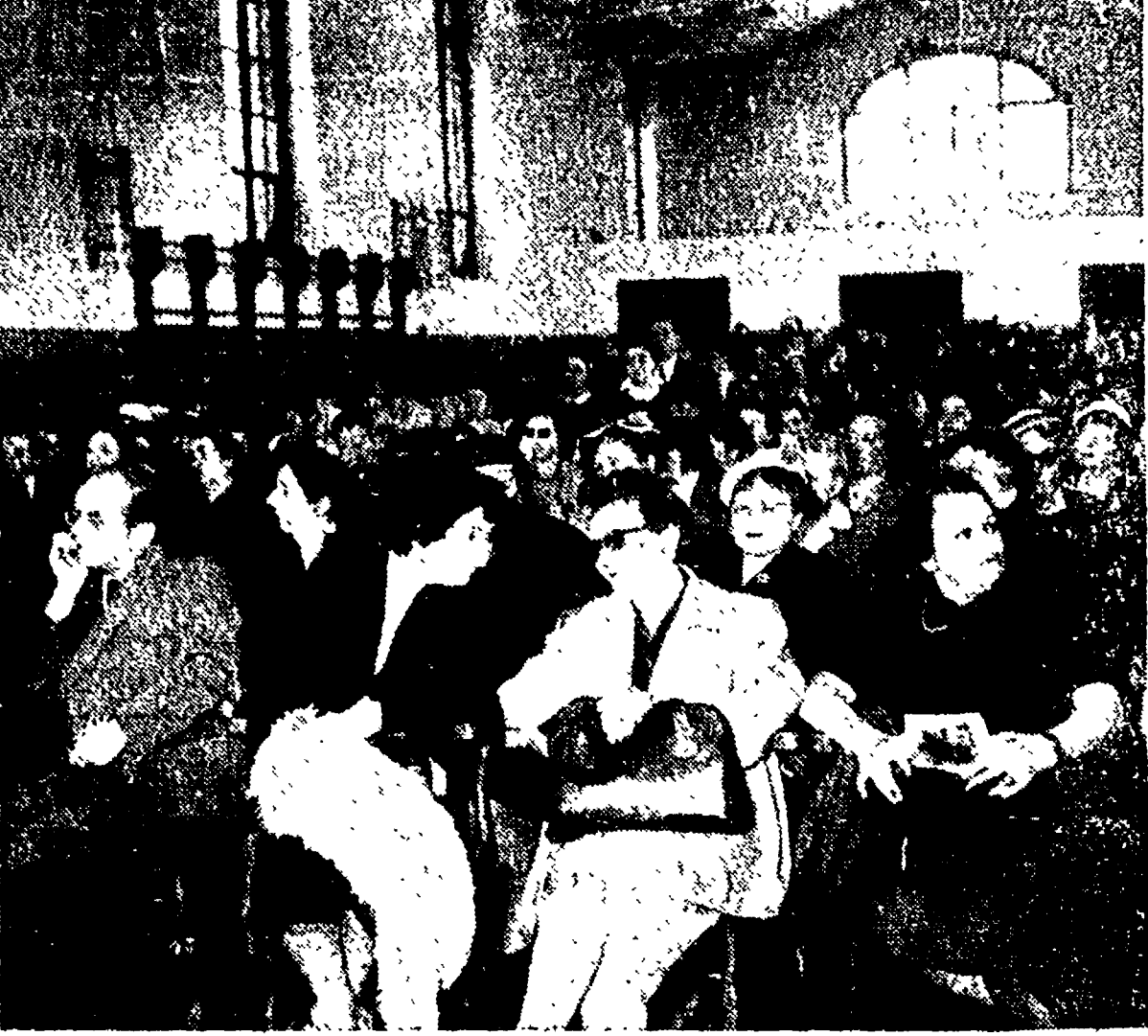
Nel corso della prima giornata dello sciopero nazionale dei professori, in numerose città si sono tenute grandi assemblee alle quali gli insegnanti hanno partecipato in massa. Nella foto: un aspetto della manifestazione di Roma, svoltasi al Liceo Mamiani