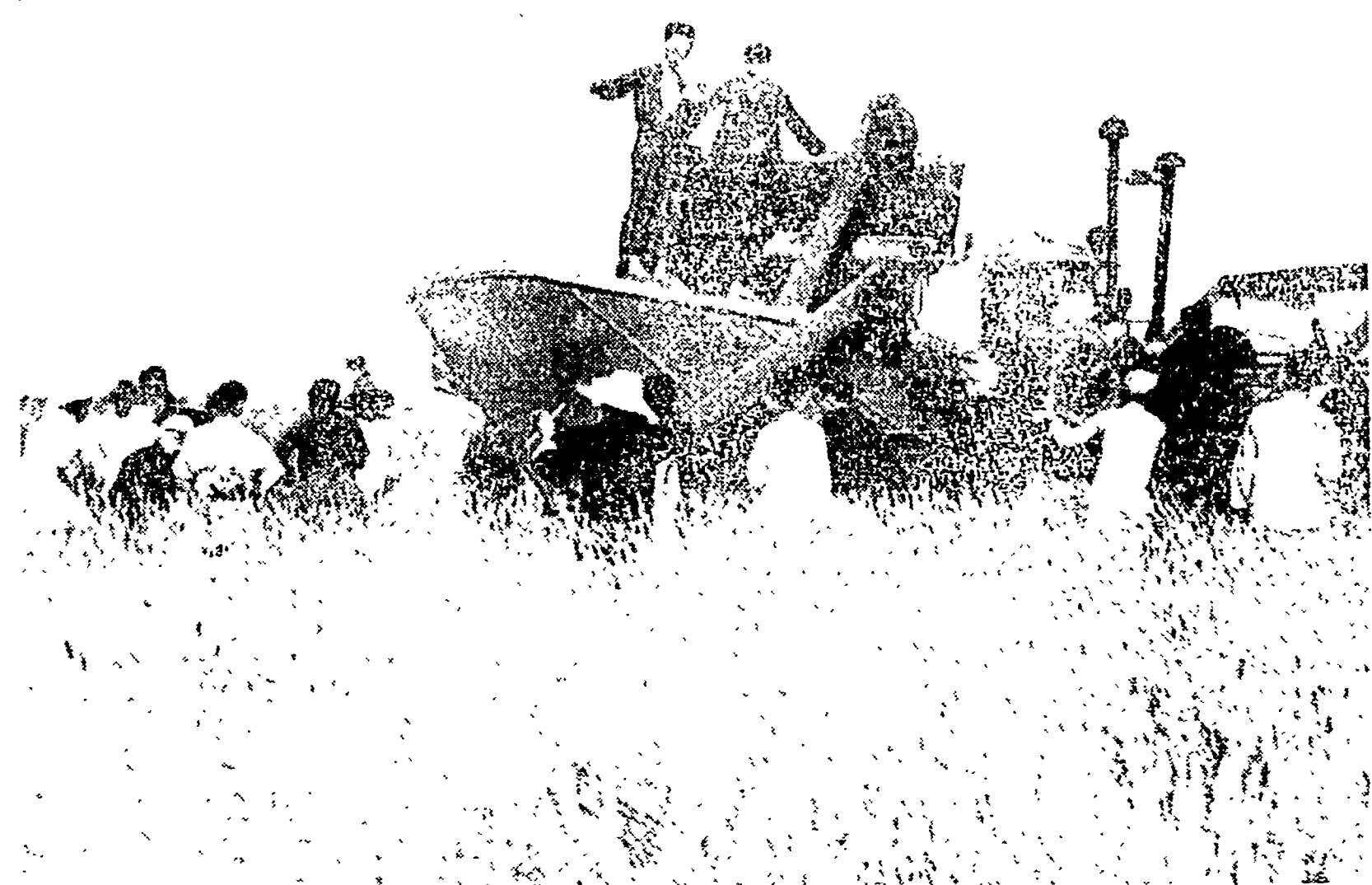
CINA - Con l'aiuto di questa grande e potente macchina i membri di una cooperativa agricola danno inizio alla coltivazione

Le informazioni di «24 Ore» - L'oro bianco italiano - I bilanci della Società Monte Amiata e i conti del Consiglio di gestione - Le direttive della Confindustria