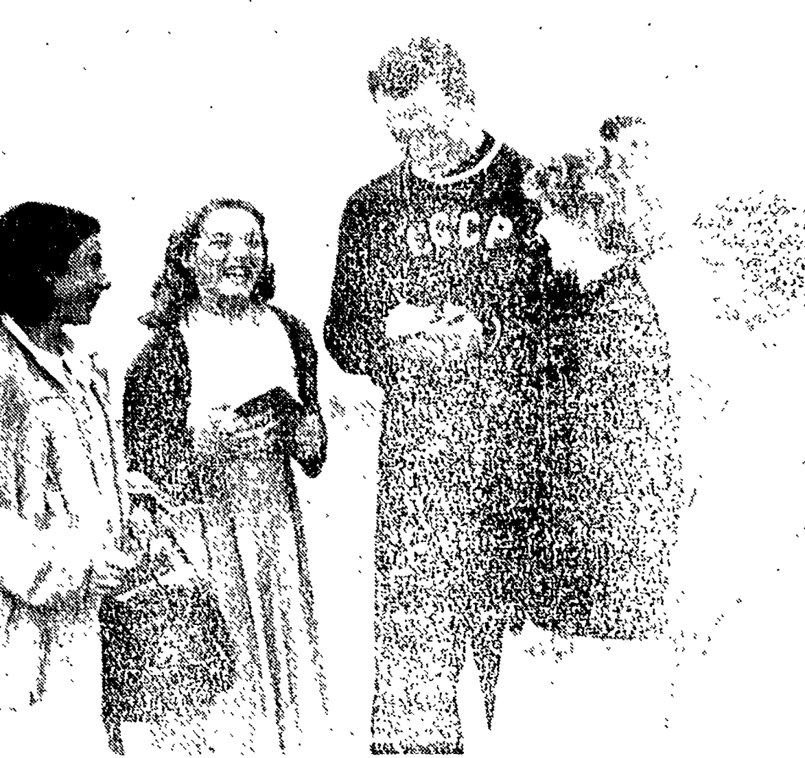
INGHILTERRA - L'atleta sovietico Brutati, che ha partecipato alle competizioni sportive britanniche di Hestley, trova ammiratori ed alcune sue ammiratrici, studentesse di una scuola