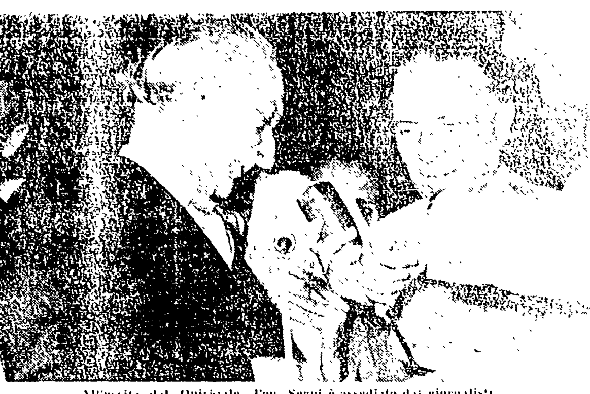
All'uscita dal Quirinale, l'on. Segni è assediato dai giornalisti.

Il Presidente della Repubblica ha ricevuto oggi l'onorevole Antonio Segni il quale gli ha riferito sugli ulteriori contatti con gli esponenti della coalizione democratica, facendo presente che esistono ancora alcune difficoltà derivanti dalle riserve espresse dai rappresentanti del P.L.I. in materia di prorogazione della fiducia di poter risolvere rapidamente tali difficoltà. Il Presidente Gronchi ha preso atto di questa comunicazione e ha affidato all'on. Segni, che si è riservato di accettarlo - l'incarico di formare il nuovo governo.