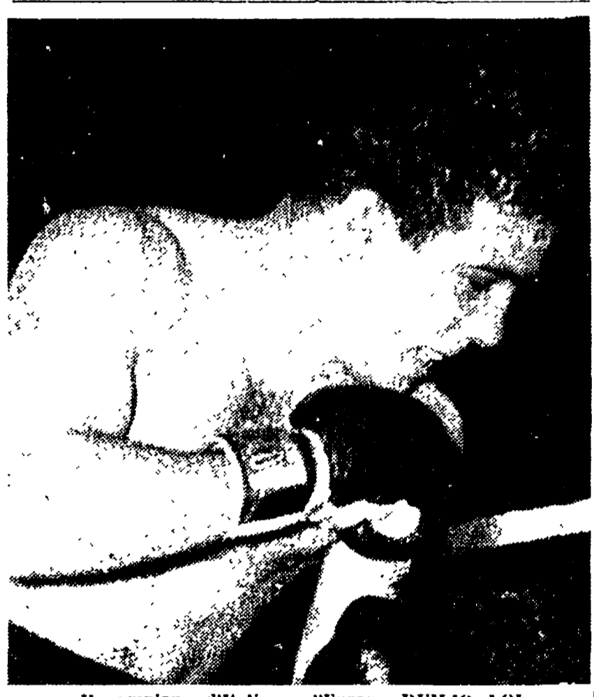
Il campione d'Italia e d'Europa DUILIO LOI