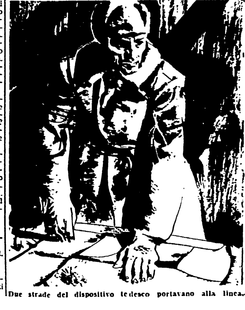
Due strade del dispositivo tedesco portavano alla linea...

E voi che ne pensate, compagno Momyse-Uly? — Non saprei, compagno generale. — Vedete, compagno Momyse-Uly, disse, ma non subito, Panfilov. — Un comandante deve sempre prevedere il peggio. Il nostro compito è di tenere la strada. Anche se sfonda, il tedesco dovrà ritrovare le nostre truppe sulla strada. Ecco perché ho tolto di là la battaglia. Volevo prendere il vostro, ma voi avete una strada importante da guardare.