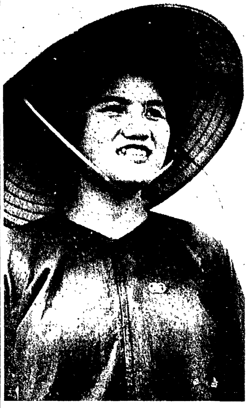
Neuyen Thi Bot è un'operata modello la quale lavora alla ricostruzione della grande chiesa di Giacuong, che fa parte del principale sistema di irrigazione del Viet-Nam democratico

Il premio Strega è stato assegnato a Giovanni Comisso per il suo romanzo «Un gatto attraversa la strada».