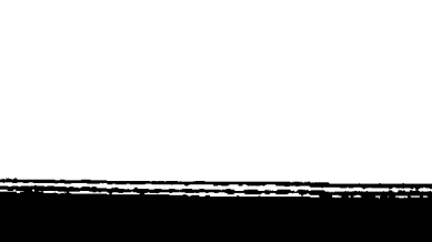
Michail Scioloikhov, l'autore del "Flacido Uno" e dei "Bisodolatori", uno tra i rappresentanti più significativi della narrativa mondiale contemporanea.

Scioloikhov propone un incontro di scrittori. La proposta sovietica sulla nuova rivista sovietica « Letteratura straniera ».