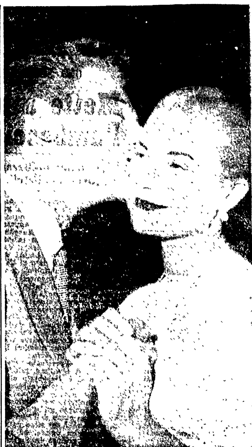
L'attrice americana Grace Kelly, apprezzata interprete del film "La ragazza di campagna", si sarebbe sposata segretamente con l'attore francese Jean-Pierre Aumont...