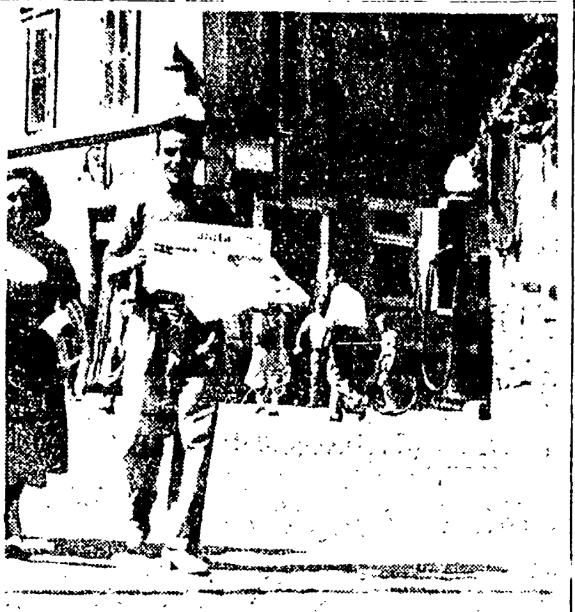
La voce dei diffusori dell'Unità eccelsa squillante per le strade del quartiere

Questi sono i compagni che, nel corso di questi ultimi anni, hanno contribuito in modo così generoso alla diffusione della nostra rivista. E noi, in questa occasione, abbiamo voluto ricordare alcuni di loro, per far conoscere il loro lavoro e il loro impegno.