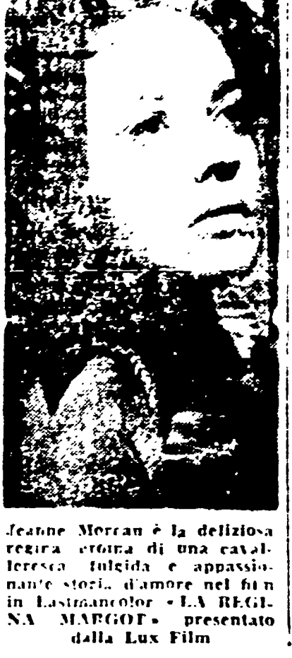
Regina Margot è la deliziosa Jeanne Moreau in una cavalcata folle e appassionante storia d'amore nel XVI secolo. L'ORA DELLA REGINA MARGOT è presentato dalla Lux Film

La regina Margot. Il film è ispirato al popolare romanzo di Alessandro Dumas. La storia è ambientata nel XVI secolo.