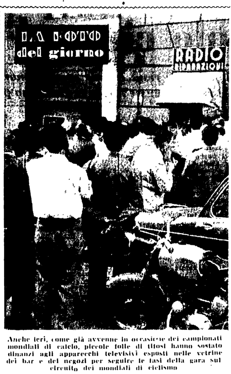
Anche ieri, come già avvenne in occasione dei campionati mondiali di calcio, piccole folle di tifosi hanno sostato dinanzi agli apparecchi televisivi esposti nelle vetrine del bar e dei negozi per seguire le fasi della gara sul circuito dei mondiali di ciclismo